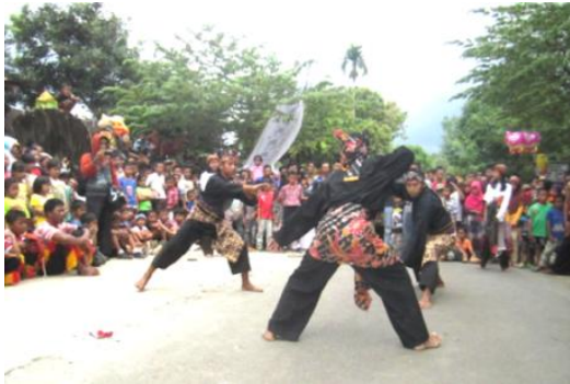
Gambar 2. Atraksi Seni Reog di Desa Wisata Betsrejo

lokal. Atraksi yang bisa dinikmati dengan menonton atraksi kesenian lokal, seperti : bambu gila, kuda lumping, reog, koreografi pencak silat, macapat, dan fragmen bocah.