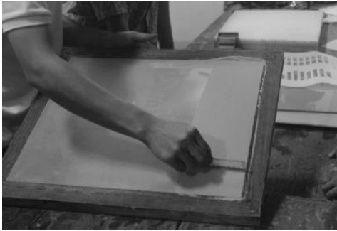
Gambar 2. Proses Praktek Langsung Pelatihan Sablon