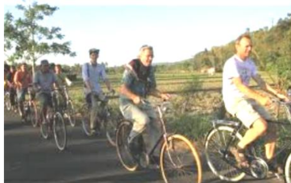
Gambar 3. Wisatawan Berkeliling Naik Sepeda di Desa Sukorejo

Di sini, pengunjung dapat mengamati proses bertani padi secara organik, serta diperbolehkan membeli langsung di lokasi langsung. Dari arah sebuah dataran tinggi, tampak aliran sungai menganak ular di dasar lembah. Pengunjung yang tergoda boleh bermain air di bagian sungai yang dangkal. Oleh warga Sukorejo, arah alir sebuah anak sungai sengaja disudet untuk mengisi kolam renang Telaga Bandut. Kolam renang ini dibangun khusus untuk anak-anak.