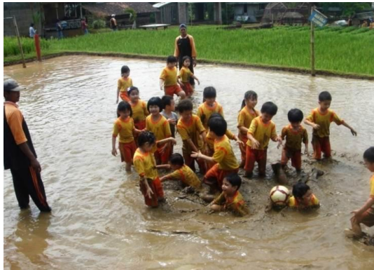
Gambar 6. Arena Bermain di Sawah untuk Anak di Desa Wisata Betisrejo Sumber : Dok. Bening, 2015