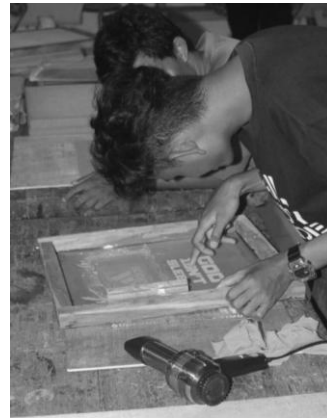
Gambar 1. Pengenalan Teknik Sablon Secara Umum

pengetahuan mengenai seputar teknik sablon secara umum, baik sejarah teknik sablon, istilah dan teknik yang berhubungan dengan sablon, prospek dan potensi dari ketrampilan sablon. Selain itu dari pelatihan selama 2 tatap muka didapat bahwa pelatihan dengan peserta dari Desa Wisata Betsrejo, Sambirejo, Sragen memang lebih mengutamakan pemberian materi melalui media demonstrasi dan menggunakan tayangan baik dua dimensi maupun audiovisual. Melalui media demonstrasi yang dapat menjelaskan mengenai ketrampilan teknik sablon dimana peserta akan langsung mengenal dan mengetahui apa saja materi yang diberikan walaupun tenaga penerjemah tetap diperlukan sebagai jembatan untuk hal-hal detil yang ditanyakan oleh peserta ataupun hal yang perlu dijelaskan lebih rinci dari materi pelatihan. Media tayangan audiovisual lebih diminati dikarenakan lebih menarik dan para peserta dapat melihat langsung materi dengan berulang-ulang mengenai ketrampilan sablon. Materi tersebut didapat dari mengunggah dari internet.