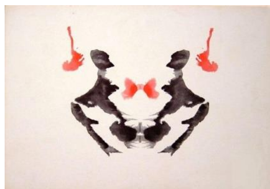
Gambar 1 dan 2

kartu bercak tinta ( inkblot ) dari tes Rorschach