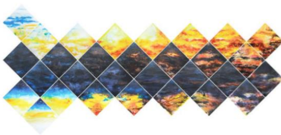
Gambar 7 dan 8

Persamaan sunset dengan lukisan shifting