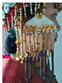
Gambar 5. “Kunci Kuluk” (Sumber: Pakaian koleksi ibuk Yuni Erawati)