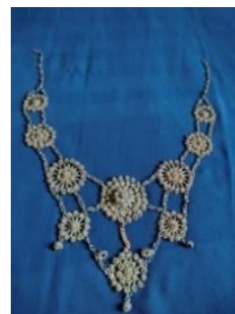
Gambar 9. “Kalung”

Aksesoris kalung yang digunakan pada busana tradisional Tari Rangguk di kecamatan Kumun Debai kota Sungai Penuh yaitu kalung dengan model bertingkat dan menggunakan motif bunga.