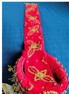
Gambar 4. “Lidah kuluk”