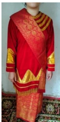
Gambar 8. “Pemakaian selempang”