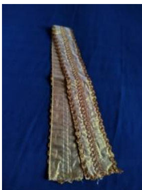
Gambar 10. “Ikat Pinggang”