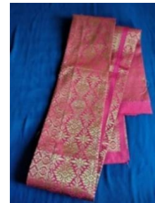
Gambar 7. “Selempang”

Pelengkap busana tradisional Tari Rangguk di kecamatan Kumun Debai kota Sungai Penuh selain kuluk ada selempang. Selempang atau bisa juga di sebut sebagai selendang, yang di pasang pada bahu kanan ke sisi sebelah kiri dan di buat menyilang dan bahan yang di gunakan sebagai selempang ini adalah kain songket yang sama seperti bahan yang di gunakan sebagai kain songket rok.