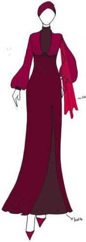
Gambar 6. Desain Terpilih Ready To Wear Deluxe (Digambar Oleh : Nur Aini, 2023)