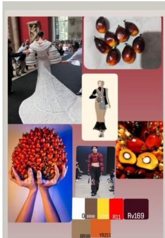
Gambar 4. Moodboard (Digambar oleh: Nur Aini,2022)