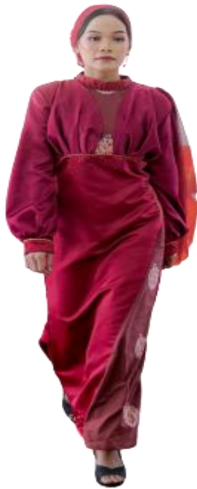
Gambar 10. Ready To Wear Deluxe

Karya 5 adalah busana ready to wear deluxe , yaitu busana yang digunakan oleh wanita dewasa pada saat tertentu seperti acara pesta, wisuda dan sebagainya. Busana ini dibuat dengan tema pesta dengan layer pada pundak sebelah kiri, dan tambahan kain silk pada bagian dada. Bagian bawah/rok dikombinasikan dengan batik, serta sentuhan payet untuk mempercantik busana ini. Ukuran busana ini yaitu L. Busana diberi lapisan furing agar lebih nyaman ketika dipakai.