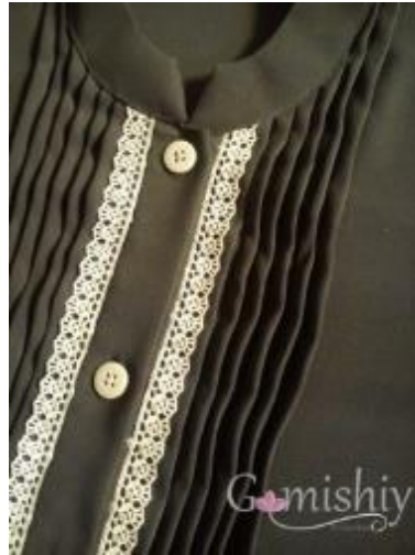
Gambar 8. Teknik Opnaisel