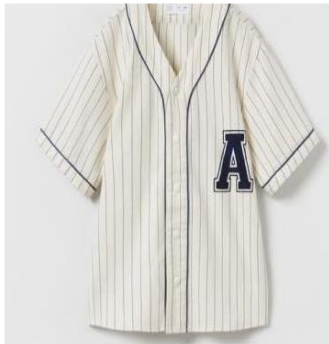
Gambar 1. Kerah V-Neck

Karya busana ready to wear, ready to wear deluxe dan haute couture mengacu pada bentuk kerah, bentuk lengan dan bentuk busana yang ada dalam acuan karya.