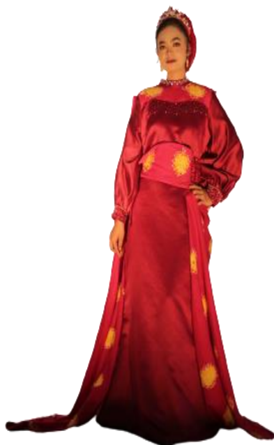
Gambar 11. Haute Couture

Karya 6 adalah busana Haute Couture , yaitu busana yang digunakan oleh wanita dewasa pada saat tertentu seperti acara pesta. Busana ini dibuat dengan tema pesta dikombinasikan dengan batik. Busana terdiri atas 2 potongan yaitu dress yang dikombinasikan dengan batik pada bagian dada dan layer pada bagian belakang yang terbuat dari batik, tambahan obi dengan teknik opnaisel, serta sentuhan payet untuk mempercantik busana ini. Lengan bishop melengkapi busana ini. Ukuran busana ini yaitu L. Busana diberi lapisan furing agar lebih nyaman ketika dipakai.