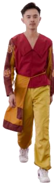
Gambar 9. Ready To Wear

Karya 1 adalah busana casual ready to wear , yaitu busana siap pakai yang digunakan oleh pria dewasa. Busana ini memiliki kerah yang berbentuk V dan juga berbentuk kemeja lengan panjang dan ada celana disertai dengan tambahan layer yang terpisah pada bagian celana yang diikatkan layer pada bagian pinggang. Pengkarya menambahkan kancing yang tersembunyi pada bagian depan baju agar terlihat rapi. Busana diberi lapisan furing agar nyaman ketika dipakai dan busana ini berukuran L.