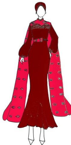
Gambar 7. Desain Terpilih Haute Couture (Digambar oleh: Nur Aini, 2023)