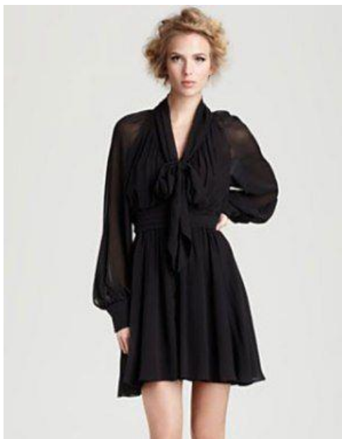
Gambar 2. Bentuk Lengan bishop