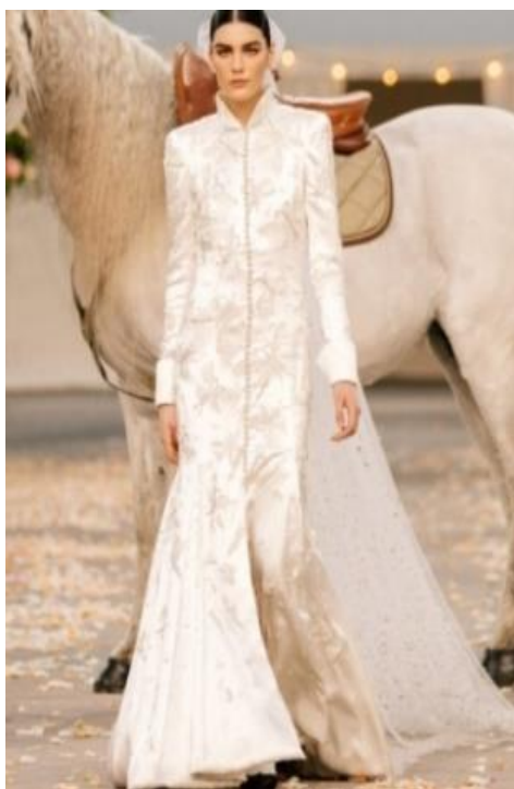
Gambar 3. Busana Pesta