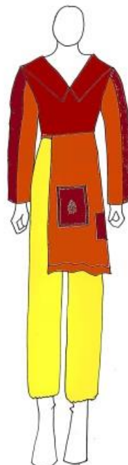
Gambar 5. Desain Terpilih Ready To Wear (Digambar oleh: Nur Aini, 2023)