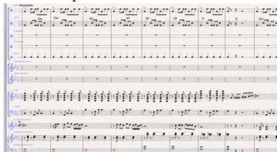
Notasi 7. Aransemen bagian Interlude lagu Zapin Usik Mengusik (Arransemen:Aldi Sumbari Putra, 2023)

Notasi di atas, dimainkan dari birama 71 (lima puluh tujuh) sampai birama 79 (enam puluh lima). Pada bagian chorus ini akord yang digunakan berbeda dari akord yang dimainkan pada bait-bait sebelum nya. Yaitu: A#, D#, Fm, dan Cm. pada bagian ini instrument yang digunakan Seperti, gitar elektrik, gitar bass, keybord string, accordion, Setelah bagian chorus Lagu zapin usik mengusik, kemudian masuk kebagian interlude seperti di bawah ini: