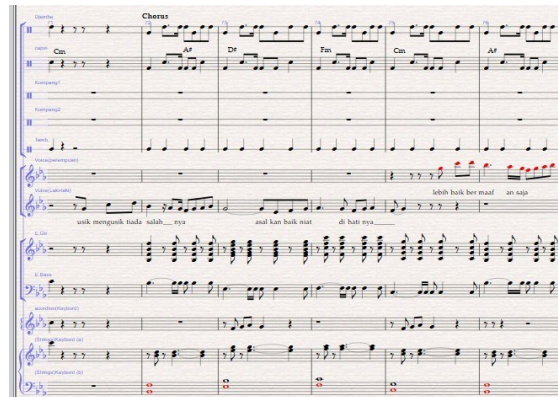
Notasi 6. Aransemen bagian Chorus lagu Zapin Usik Mengusik (Arransemen:Aldi Sumbari Putra, 2023)

Notasi di atas, dimainkan dari birama 63 (enam puluh tiga) sampai birama 70 (tujuh puluh). Seperti yang terlihat pada notasi di atas, akord yang digunakan juga sama dengan bagian verse Sebelumnya. Dibagian ini juga, instrument accordion sebagai pengisi melodi filler dan melodi background. Setelah bagian verse bermain dalam Lagu zapin usik mengusik. Kemudian masuk kebagian chorus. Chorus yang dimaksud pada lagu zapin usik mengusik seperti di bawah ini: