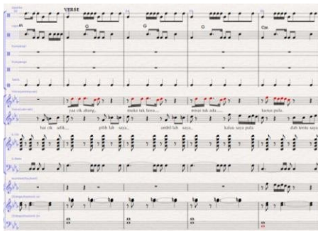
Notasi 5. Aransemen bagian Verse lagu Zapin Usik Mengusik (Arransemen:Aldi Sumbari Putra, 2023)

Setelah bagian bridge lagu selesai, kemudian masuk kebagian verse. Verse yang dimaksud pada lagu zapin usik mengusik seperti di bawah ini: