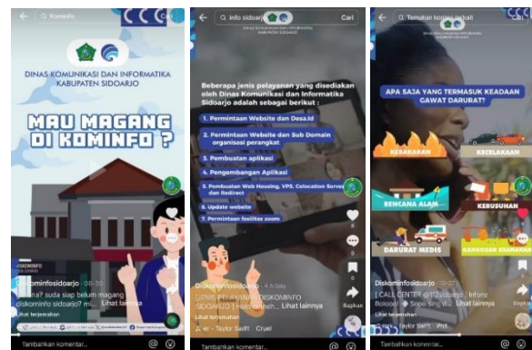
Gambar 2. Akun Tiktok Milik Diskominfo Sidoarjo

Adapun contoh konten dari akun TikTok DISKOMINFO Sidoarjo :