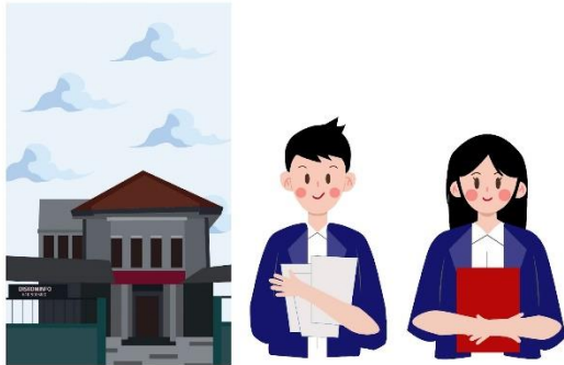
Gambar 4. Asset Konten TikTok Milik DISKOMINFO Sidoarjo

dalam penggunaan warna tertentu dapat memperkuat identitas merek, meningkatkan daya ingat, dan membuat konten menjadi mudah untuk dikenali oleh audiens. Dengan konsistensi warna DISKOMINFO Sidoarjo dapat meningkatkan visual yang kuat dalam konten TikTok mereka. memberikan kesan yang seragam, serta meningkatkan estetika dan profesionalisme konten yang akan disampaikan kepada audiens. Hal ini dapat membantu dalam membangun hubungan yang kuat antara akun TikTok dan pengikutnya.