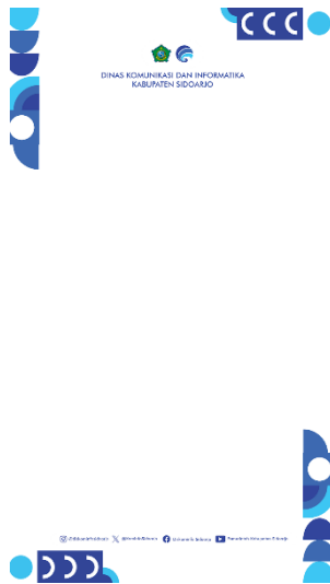
Gambar 1. Template Desain Konten Tiktok Milik Diskominfo Sidoarjo

Gambar 1 di atas adalah template yang dimiliki oleh akun TikTok milik DISKOMINFO Sidoarjo. Pada template tersebut terdapat supergrafis, logo DISKOMINFO, logo PEMKAB Sidoarjo dan nama akun-akun media sosial yang dimiliki oleh DISKOMINFO Sidoarjo. Template yang digunakan oleh akun TikTok DISKOMINFO Sidoarjo merupakan hal yang konsisten dalam penyampaian pesan pada konten yang mereka miliki, hal ini berguna untuk mengenalkan identitas dan memberikan ciri khas kepada para pengikutnya. Dengan adanya supergrafis, logo DISKOMINFO, logo PEMKAB Sidoarjo, dan daftar media sosial milik DISKOMINFO Sidoarjo, template tersebut memberikan kesan yang seragam dan mudah untuk dikenali bagi para pengguna TikTok yang telah mengikuti akun tersebut.