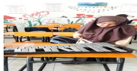
Gambar.12 Latihan Instrumen Lyra

Gambar di atas merupakan proses pembelajaran instrumen lyra terhadap peserta didik.