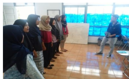
Gambar. 4 Latihan Artikulasi

Tahap selanjutnya penulis melatih artikulasi seperti gambar di bawah ini :