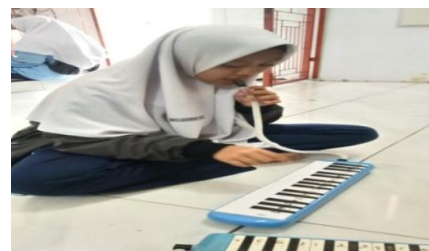
Gambar.11 Latihan Instrumen Pianika

Gambar di atas merupakan pembelajaran yang penulis lakukan terhadap siswa. Tindakan yang dilakukan yaitu dengan cara menjelaskan dan mempraktekkan langsung kepada peserta didik mengenai progres akord yang digunakan dalam aransemen lagu Ya Maulana , mempraktekkan cara memainkan akord lagu tersebut pada gitar dengan tehnik yang benar dan mudah. Pada proses latihan siswa tidak mengalami kendala apa-apa.