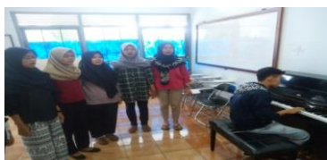
Gambar. 5 Latihan Intonasi

Selanjutnya penulis melatih intonasi, latihan intonasi yang penulis lakukan di sini adalah dengan cara mensolmisasikan nada dibantu dengan iringan instrumen piano seperti pada gambar di bawah ini :