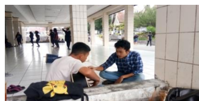
Gambar. 9 Proses Latihan Instrumen Gitar 1