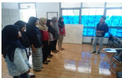
Gambar. 3 Latihan Pernafasan

Tahap yang penulis lakukan pada proses pembelajaran yaitu dengan melatih pernafasan seperti pada gambar berikut ini :