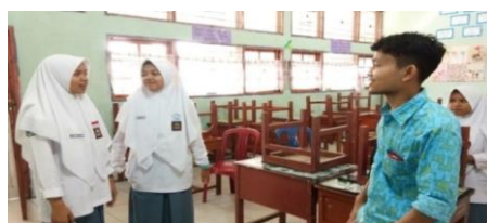
Gambar. 8 Pembelajaran vocal group lagu Ya Maulana : latihan suara 3

Gambar di atas merupakan latihan suara 3 lagu Ya Maulana terhadap peserta didik berdasarkan pola melodi di atas. Dalam latihan suara 3 peserta didik masih jauh dari intonasi yang dicontohkan. Dalam hal ini penulis mencoba berulang-ulang kali mendemonstrasikan pola melodi di atas hingga peserta didik mulai menguasai pola melodi tersebut secara perlahan.