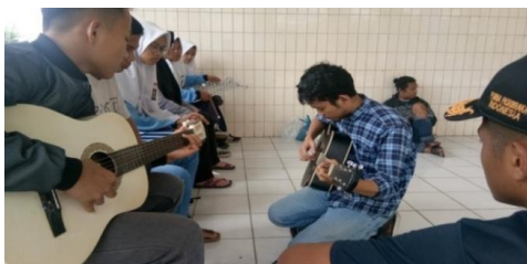
Gambar.10 Latihan Instrumen Gitar