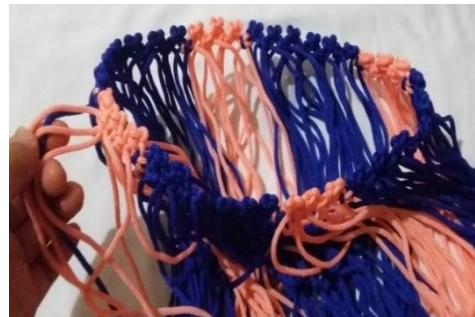
Gambar 5. Mengabungkan simpul kordon