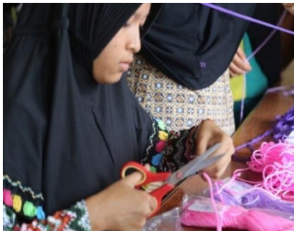
Gambar 3 Memotong tali kur

Membuat tas ukuran 24 x 18 cm, memerlukan 6 gulung tali kur, dipotong dengan panjang 180 cm x 72 helai, memotong tali kur dapat menggunakan gunting sebagai alat untuk memotong.