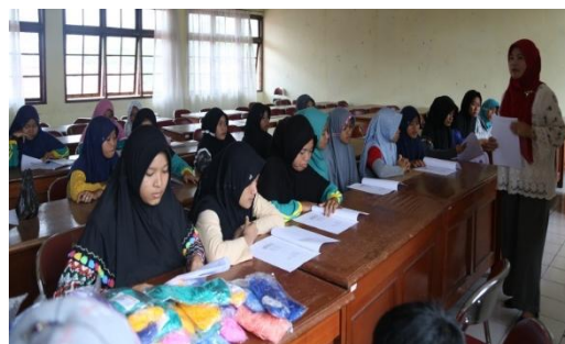
Gambar 1. Menjelaskan materi makrame

Pada pertemuan pertama pelatihan, makrame dijelaskan secara teori seperti pengertian makrame, macam-macam simpul makrame dan contoh produk makrame.