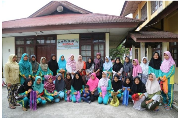
Gambar 20 Peserta pelatihan