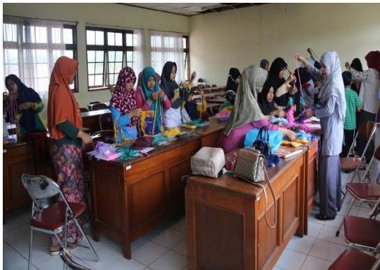
Gambar 19 Suasana pelatihan