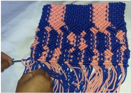
Gambar 7 Membuat landasan tas

Landasan tas dimakram dengan simpul pipih ganda, seluruh tali kur yang terurai pada tas di simpul ini bertujuan agar dapat menahan seluruh isi tas nantinya.