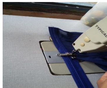
Gambar 10 Menjahit resleting

Resleting dijahitkan pada puring dengan menggunakan mesin jahit, panjang resleting yang digunakan disesuaikan dengan lebar tas, tas dengan lebar 30 cm membutuhkan resleting dengan panjang sekitar 35 cm, 5 cm disisakan untuk jahitan.