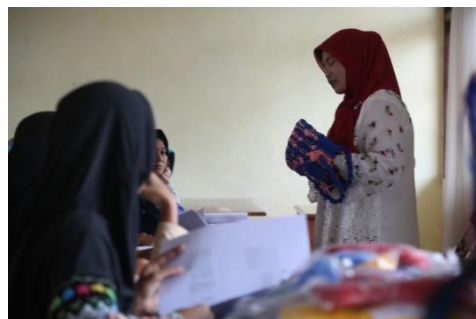
Gambar 2 Memperlihatkan contoh tas makrame