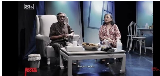
Gambar 2. Spektrum Pencahayaan Pertunjukan Teater Termediasi Pandemi

Berdasarkan gambar 2 di atas, pencahayaan didominasi oleh spektrum cahaya berwarna putih dan biru. Biru sering dianggap sebagai warna yang tenang dan damai. Biru juga dapat digunakan untuk menciptakan suasana yang santai dan tenang, atau untuk menandai elemen-elemen penting dalam pertunjukan. Sedangkan warna putih digunakan untuk menggambarkan suasana yang bersih dan sederhana.