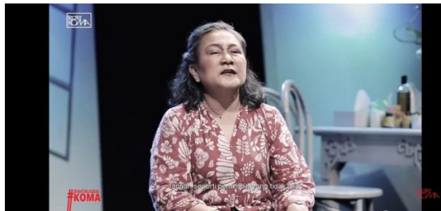
Gambar 1. Subtitle dalam pertunjukan digital Pandemi karya Nano Riantiarno (Dokumentasi Youtube, 2022)

Konteks pertunjukan teater termediasi Pandemi , artikulasi dialog dibantu oleh penggunaan sulih teks (subtitle). Subtitle berarti “kata-kata yang ditampilkan di bagian bawah film atau gambar televisi untuk menjelaskan apa yang dikatakan” (Cambridge, 2022). Subtitle merupakan bagian penting dalam tv dan film sebagai penjelasan dialog yang disampaikan oleh aktor. Dialog yang diucapkan oleh aktor secara otomatis tertera di bagian bawah layar. Penggunaan gaya bahasa diatur oleh editor, sehingga pilihan bahasa yang beragam diterjemahkan secara langsung oleh sistem. Oleh karena itu, penonton yang memiliki latar geografis yang berbeda mampu memahami pertunjukan secara lancar, dan dapat mengerti setiap kata yang diucapkan oleh aktor selama pertunjukan berlangsung.