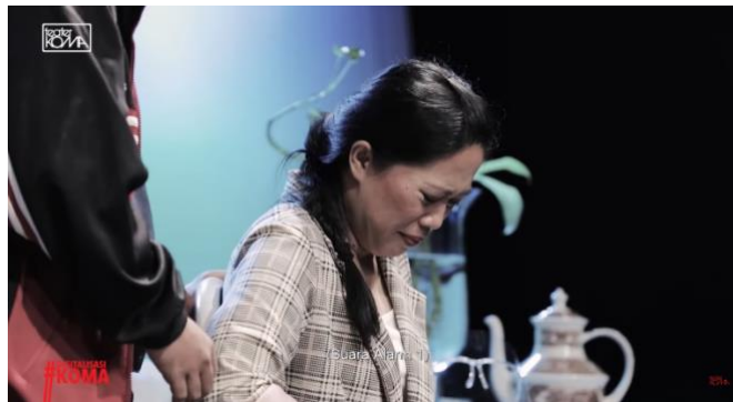
Gambar 5. Blocking Aktor dalam Pertunjukan Pandemi (Dokumentasi Youtube, 2022)

Pertunjukan teater termediasi Pandemi , blocking aktor juga sepenuhnya diatur oleh komposisi kamera. Aktor sebisa mungkin untuk “sadar kamera” dalam melakukan aksi di atas panggung. Posisi kamera yang mengawasi setiap pergerakan aktor bisa menangkap setiap momen yang terjadi di atas panggung. Kehadiran kamera juga menjaga kontinuitas pertunjukan, supaya setiap gambar yang dilihat oleh penonton tidak mempengaruhi plot dan dramatik pertunjukan.