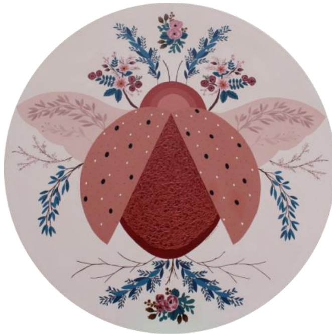
Gambar 4. “Atraktif”