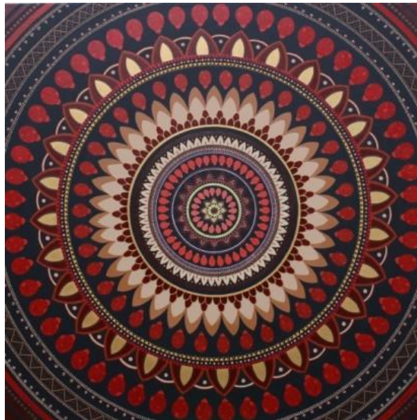
Gambar 3. “Tarian Kumbang Koksi”