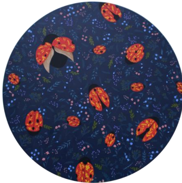
Gambar 2. “Home”