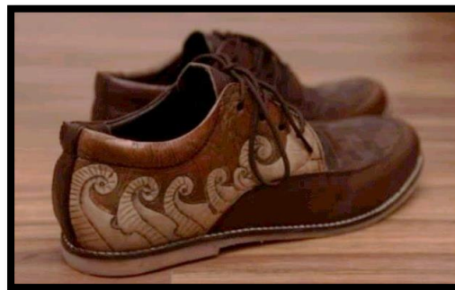
Gambar 2. Sepatu Oxford Casual (Sumber: Karya Iqbal Saputro, 2017)

Gambar di atas merupakan salah satu karya dari Niko Andeska. Menerapkan oen ranup sebagai ide pengkaryaan. Bentuk karya yang diciptakan berbentuk hiasan dinding menggunakan media kayu yang berukuran 120 cm x 60 cm. Karya yang diciptakan oleh Niko Andeska terdapat penerapan oen ranup pada hiasan dinding tersebut. Karya hiasan dinding ini menggunakan teknik ukir, menggunakan media kayu dan menggunakan warna woodstain , melamine sanding seale dan melamine clear gloss .