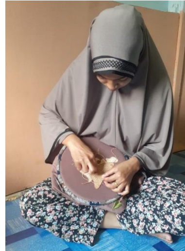
Gambar 10. Memenuhi sulam tusuk peniti pada bagian wajah

d. Menjahit sulam tusuk peniti pada bagian wajah