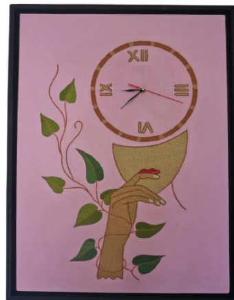
Gambar 14. “Ingat Watee” Media: Benang Sulam Rose, Benang Bordir, Kain Kanvas, kayu, Jarum jam, cat acrylic Ukuran: 75x50 cm Tahun: 2022