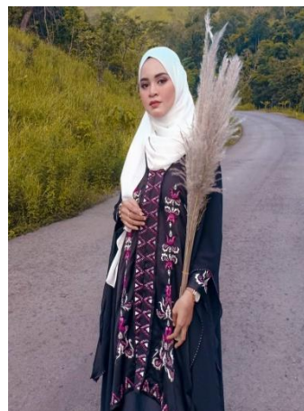
Gambar 3. Disayangi (Sumber: Karya Rauzatun Magfirah, 2020)

Karya di atas berjudul “Sepatu Oxford Casual” karya tersebut berupa sepatu pria yang dibuat pada tahun 2017. Penggarapannya menggunakan teknik full handmade . Kesamaan karya dengan perbandingan adalah sama-sama menggunakan oen ranup .