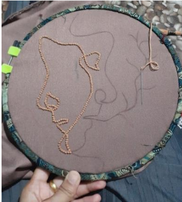
Gambar 8. Menjahit sulam tusuk peniti pada bagian karya