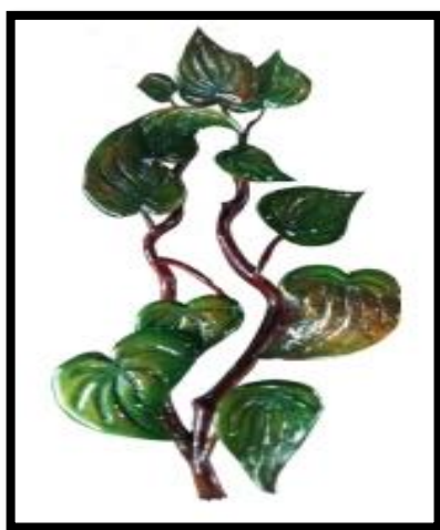
Gambar 1. Hiasan Dinding

“Orisinilitas adalah suatu proses kreatif yang melibatkan perenungan secara mendalam serta menghindari peniruan. Karya seni dianggap orisinal jika sebuah karya dapat menampilkan kebaruan konsep, persoalan, bentuk, atau gaya yang baru dan menjadi karya yang memiliki kebaruan, dilihat dari adanya kecakapan konseptual” (Sumartono, 1992: 2).