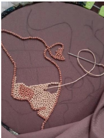
Gambar 9. Menjahit sulam tusuk peniti pada bagian wajah

d. Menjahit sulam tusuk peniti pada bagian wajah