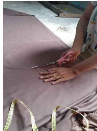
Gambar 6. Proses memotong kain untuk karya bantal sofa.