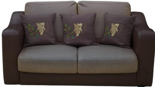
Gambar 12. Karya bantal sofa