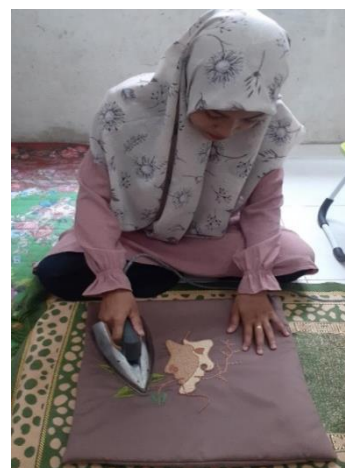
Gambar 11. Finishing karya