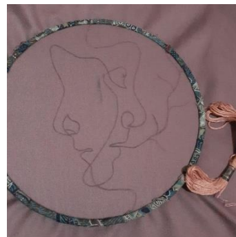
Gambar 7. Desain yang sudah di pindahkan ke kain