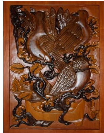
Foto 2. Ojo Waton Cangkeman Pahat Relief pada Kayu 100 x 60 cm 2017