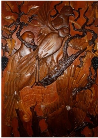
Foto1. Turangganing Kutut Manunggaling Manungso Pahat Relief pada Kayu 200 x 120 cm 2017