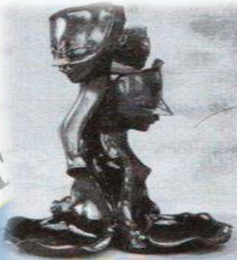
Gambar. 06 Karya Tugas Akhir Mahasiswa ISI Yogyakarta