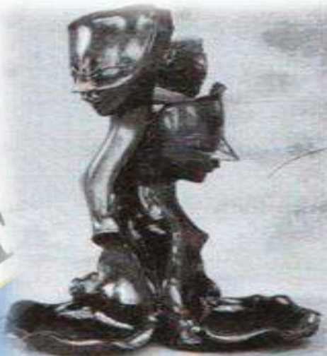
Gambar. 06 Karya Tugas Akhir Mahasiswa ISI Yogyakarta