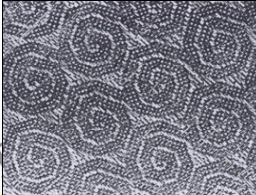
Motif Corak Senagir

Iban Saribas menggunakan motif Bintang dalam seni rupa (anyaman) kerana bintang mempunyai pengaruh yang begitu mendalam dalam kehidupan masyarakat berkenaan dan memainkan peranan dalam kerja menanam padi bukit. Apabila Iban Saribas hendak memulakan kerja menanam benih padi bukit, mereka mesti melihat bintang dan terdapat dua jenis bintang yang mempunyai peranan dalam pertanian padi bukit iaitu bintang banyak atau bintang tujuh dan juga bintang tiga.