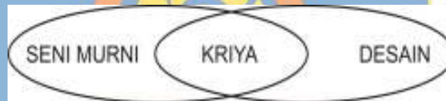
Gambar. 03 Posisi kriya diantara seni murni dan desain (Dafri: 2000)

Sesungguhnya kriya berada dan mencakup kedua disiplin ilmu tadi, seni dan desain, sehingga memungkinkan muncul dua istilah seperti kriya seni dan kriya desain, atau seni kriya dan desain kriya. Pada kenyataannya kriya memiliki fleksibilitas yang tinggi, berada pada posisi di antara wilayah seni dan desain. Kondisi ini menyadarkan kita bahwa seharusnya tidak ada definisi yang kaku dalam pengelompokan kriya, karena hal ini tergantung di wilayah mana secara esensial kriya itu sendiri berkeaktifitas (Zuhdi, 2003: 21).