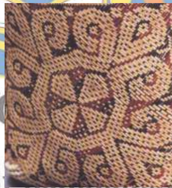
Motif Bulan Dalam Seni Anyaman (Blehaut 1992:166)

Motif Bulan pada seni tradisi Iban yang dicipta dalam seni anyaman digunakan untuk menganyam bakul ataupun tikar bembau. Bulan sangat banyak memainkan peranan dalam kehidupan Iban tradisi seperti yang sedia maklum. Bulan dipandang sebagai salah satu daripada objek kosmos dan ia sangat berkait-rapat dengan kehidupan Iban seperti dalam bidang pertanian,