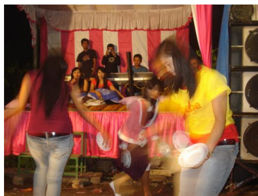
Tari Piring Para Pendangdut Saluang Orgen di Daerah Solok

pada pertunjukan Saluang Orgen yaitu 1) penggunaan instrumen saluang; 2) penyajian dangdut tradisional [dangdut ratok]; 3) tata pentas dengan pemakaian lampu terang biasa; dan 4) susunan duduk pendangdut yang bersaf dari kiri ke kanan. Sedangkan materi Saluang Orgen yang terbawa dari pertunjukan Orgen Tunggal adalah penyajian lagu-lagu dangdut dan house musik serta cara berpakaian dan tarian yang semi erotis.