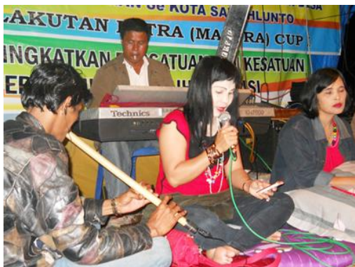
Pertunjukan Saluang Orgen di Kota Sawah Lunto oleh Grup Orgen Tunggal Mustika Solok dan Grup Saluang Junita dari Kota Beras

sama-sama suka dengan suguhan perpaduan musik tersebut. Salah satu dampak positifnya, kegarangan kaum muda yang sering lupa diri begitu menikmati dentuman musik tripping dari hiburan Orgen Tunggal bisa diminimalisir secara bertahap. Kaum muda pun mulai terbiasa dengan hiburan saluang. Generasi tua dan generasi muda pun mulai berbaur dalam menikmati hiburan, sehingga suasananya lebih terkendali. .... Sementara itu, Junita pemilik kelompok saluang mengatakan, kehadiran Orgen Tunggal dalam mengiringi kesenian saluang, memberikan dampak positif, yang berdampak semakin ramainya peminat dan penonton, ketika pagelaran Saluang dan Orgen Tunggal [ Saluang Orgen ] dilakukan.