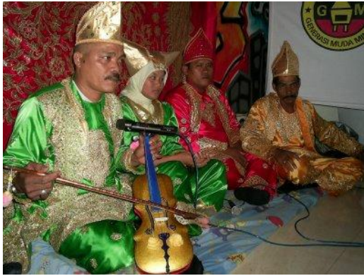
Pertunjukan Rabab Pasisia (Koleksi Foto: Yunaidi, 2010)