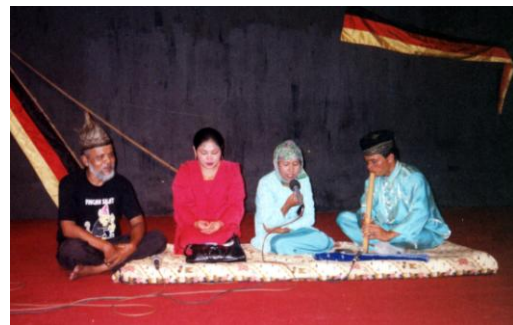
Pertunjukan Saluang Dendang Darek di Taman Budaya Padang

sama aktif, membaur dalam kebersamaan. Dalam bagurau berkumpul orang yang sehoobi, tidak muncul lagi perbedaan status sosial, semua mereka berstatus sama yaitu anggota bagurau . Dengan kata lain, bagurau adalah suatu aktivitas sekelompok orang yang ingin bergembira, melakukan hiburan bersama untuk sesama, dalam bentuk pertunjukan Saluang dan Dendang (Gitrif Yunus, 1992: 22).