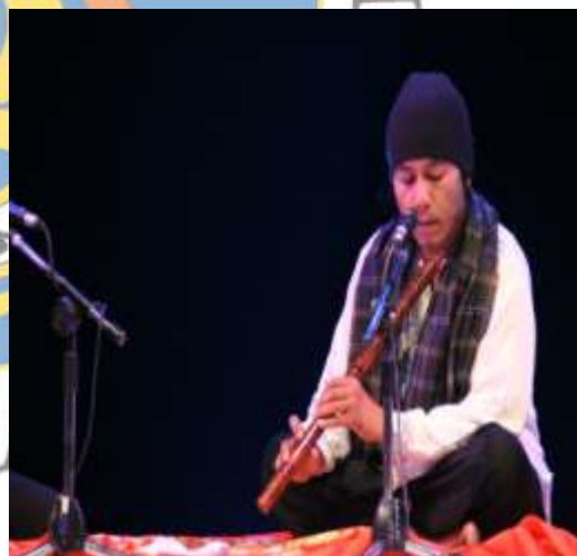
Sikap duduk dalam bermain saluang

Seperti paparkan Gitrif Yunus dalam penelitiannya, ada kriteria-kriteria yang harus dilakukan oleh tukang saluang maupun