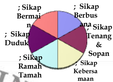
Sikap-sikap pemain saluang dendang dalam sajian bagurau

Unsur-unsur estetik dengan berbagai kriteria tersebut di atas, tidak digunakan untuk ‘menghakimi’ atau mengintervensi tentang kriteria permainan saluang yang baik, akan tetapi untuk memberikan gambaran bagaimana seorang pemain atau penyaji saluang dalam pertunjukan bagurau menggunakan/memanfaatkan segala kemampuannya untuk mencapai kualitas estetik. Untuk memposisikan bagaimana ‘strategi’ pemain saluang dalam menyikapi kelemahan/kekurangan maupun kelebihan untuk dijadikan kekuatan dalam mencapai kualitas estetik pertunjukan saluang dendang .