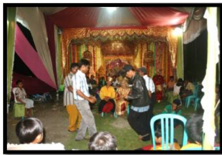
Gambar 2. Pertunjukkan Musik Ronggeang dalam cerita Randai “ Lareh Simawang ” (Foto: Nora Anggraini, 1 Juni 2013)

mengkolaborasikan pertunjukkan Ronggeang dengan pertunjukkan Randai . Dua jenis kesenian ini disatukan dalam pertunjukkan dengan tidak mengurangi bentuk dari masing-masing jenis keseniannya. Dari segi komposisi dan pertunjukkan Ronggeang tidak ada yang berubah, tetapi yang berbeda adalah waktu kapan Ronggeang ini akan tampil di dalam sesi-sesi Randai .