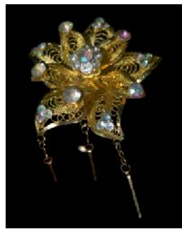
Gambar 5. Bungo gadang / Kambang goyang