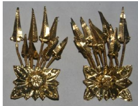
Gambar 3. Mansi-mansi