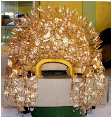
Gambar 1. Bentuk Suntieng Gadang di Kecamatan Lubuk Alung

merak. Untuk hiasan yang paling atas dipasang mansi-mansi kemudian di bagian samping yang jatuh ke pipi kanan dan pipi kiri pengantin dipasangkan kote-kote. Selain kelimanya di bagian pipi kanan dan pipi kiri juga ditambahkan bunga hidup, seperti bunga melati dan bunga cempaka yang telah dirangkai dengan benang, kedua jenis bunga ini dapat memberikan keharuman bagi sang pengantin.