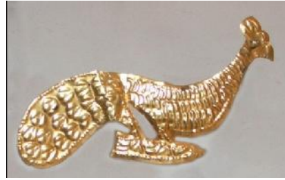
Gambar 7. Motif Burung Merak