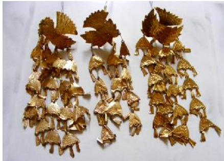
Gambar 6. Kote-kote (Motif burung dan ikan)

Suntiang gadang adalah salah satu benda kriya yang sangat berarti dalam kehidupan sosial masyarakat Padangpariaman terutama dalam adat perkawinan. Keberadaan ragam hias sebagai elemen pembentuk suntiang tidak saja berfungsi sebagai hiasan untuk memperindah, tetapi juga terkandung makna yang mengandung pesan yang harus dipahami dan diaplikasikan dalam kehidupan sosial rumah tangga, agar terciptanya rumah tangga yang rukun dan bahagia.