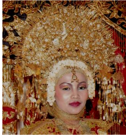
Gambar 2 Bentuk Suntieng yang tertata di atas kepala anak daro

Berdasarkan dari bentuk suntieng gadang di atas, maka dapat dilihat secara dekat beberapa bentuk motif diantaranya: