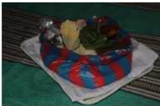
Gambar 1 : Syarat dan Properti digunakan dalam Silek Tuo Gunuang (Dokumentasi: Nurfitri, 14 Juni 2021)

untuk pembeli Kopi, gula, dan gorengan saat latihan.