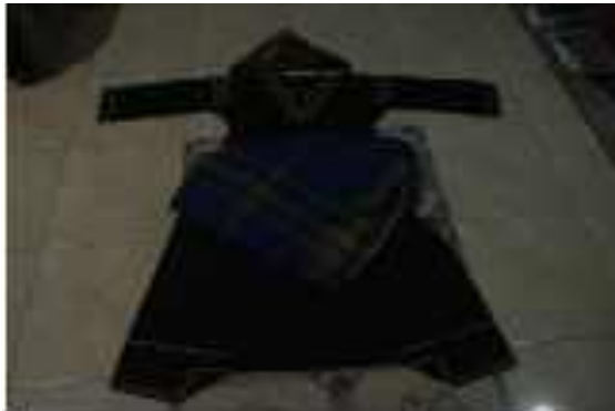
Gambar 7 : Kostum Silek Lanyah

Pemain Silek Lanyah menggunakan kostum untuk atraksi. Kostum dari Silek Lanyah ini yaitu berbaju hitam taluak Balango, celana hitam galembong, bagian kepala memakai yang namanya desta dan bagian pinggang pakai sasampiang dari kain sarung. Baju dan celana yang dipakai Silek Lanyah juga bertukar warna merah dan kadang berwarna hijau, baju pada Silek Lanyah ini tidak ditentukan harus berwarna hitam yang seperti ketentuan pada Silek Tuo Gunuang.