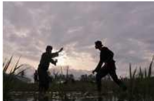
Gambar 5 : Praktek Silek Lanyah

Pergerakan ini dilakukan dalam bentuk mengangkat kembali nilai-nilai kearifan local Minangkabau agar tidak terkikis oleh masa saat ini. Seperti yang dijelaskan oleh kesenian tradisi Silek Lanyah ini bertujuan untuk melestarikan dan serta bisa dikenal, diterapkan untuk generasi selanjutnya. Silek Lanyah dikemas menjadi sebuah atraksi pertunjukan didasarkan kepada seni bela diri asli Minangkabau yaitu silek. Silek Lanyah juga merupakan atraksi yang dimainkan pada area berlumpur yang biasanya lokasi di sawah yang akan dibajak. Secara umum atraksi Silek Lanyah di Kubu Gadang banyak mengundang wisatawan dalam negeri maupun luar negeri untuk datang menyaksikan atraksinya. Dengan adanya Silek Lanyah ini Masyarakat Kubu Gadang bekerja sama dengan Dinas Pariwisata yang menjadikan Silek Lanyah sebuah ikon budaya yang ada di Kota Padang Panjang dikenal orang sampai ke manca Negara.