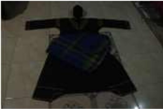
Gambar 3 : Kostum Tradisi Silek Tuo Gunuang

sarung dan peci hitam. Baju dan celana yang berwarna hitam melambangkan setiap perbuatan harus ada tanggung jawabnya.