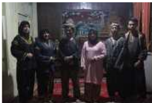
Gambar 2 : Pelaku Silek Tuo Gunuang (Dokumentasi: Nurfitri, 14 Juni 2021)

Setiap yang ingin mempelajari Silek Tuo Gunuang ini, mengharuskan kesiapan mental dan fisik dikarenakan Silek Tuo Gunuang adalah gerakan yang mematikan yang tidak dapat dipertontonkan untuk orang ramai. Saat ini Silek Tuo Gunuang sendiri bisa dikatakan tidak punah, akan tetapi diam karena belum ada lagi remaja saat ini yang memberanikan diri untuk mempelajari lebih dalam.