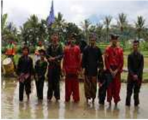
Gambar 6 : Pelaku Silek Lanyah