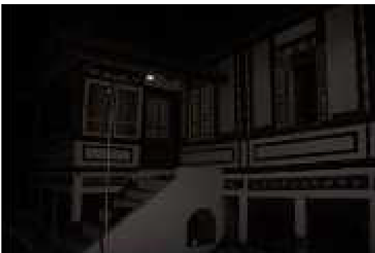
Gambar 4 : Tempat Latihan Silek Tuo Gunuang (Dokumentasi: Nurfitri, 14 Juni 2021)

Tempat latihan atau sasaran dari Silek Tuo Gunuang adalah di tempat yang kering, tepatnya di halaman surau (musholla) atau diperkarangan sekitar rumah masyarakat yang dekat dengan surau.