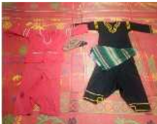
Gambar 8 : Kostum Silek Lanyah (Dokumentasi: Wardhatul Khairah, 12 Juli 2019)