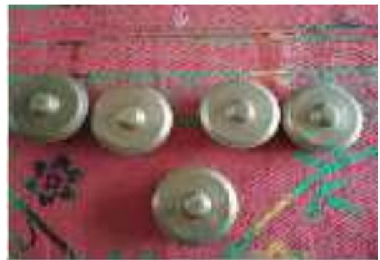
Gambar 8 : Alat Musik yang Digunakan pada Silek Lanyah (Tambua, Tansa, Talempong) (16 Juli 2019)