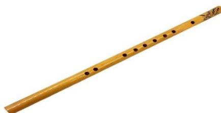
Gambar 3.11 Seruling Bambu Dokumentasi oleh Khairul Asyari, 30 Juni 2024)