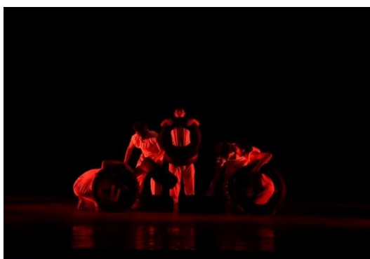
Gambar 3.21 Foto Pertunjukan Karya "Marasoi" Menggunakan Ban