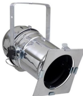
Gambar 3.12 General Light (Dokumentasi Khairul Asyari, 30 Juni 2024)

Pada karya tari ini menggunakan jenis lampu yaitu lampu general light berfungsi untuk pencahayaan umum dapat diartikan sebagai cahaya netral yang merata seluruh area panggung, kegunaan lampu ini sebagai pendukung suasana; foot light berfungsi untuk menerangi bagian bawah panggung atau objek secara detail untuk memperjelas gerak seperti pada bagian kaki; serta spot light untuk memfokuskan cahaya pada bagian panggung tertentu untuk memperjelas eksp, seperti bagian tengah panggung.