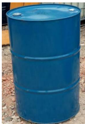
Gambar 3.10 Drum