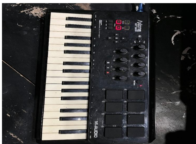
Gambar 3.9 Alat musik MD Controler