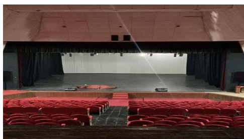
Gambar 3.22 Panggung Prosenium Gedung Pertunjukkan Hoerijah Adam

Dalam konsep keruangan yaitu tempat atau yang melingkungi objek, sehingga ruang tari merupakan ruang yang digunakan untuk pertunjukan atau pertunjukan tari dengan volume yang dapat diatur sesuai kebutuhan koreografi (Rochayati, 2017: 66). Penggunaan ruang tari tidak hanya untuk kepentingan penonton dalam menyaksikan pertunjukan tari, namun harus menyesuaikan konseptual yang mencakup isi dan makna garapan tari (Tamara, 2023).