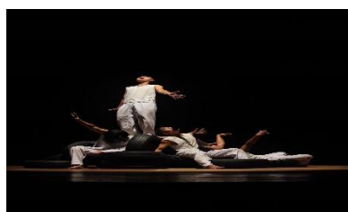
Gambar 3.5 Pose gerak pada bagian akhir dari pengendalian emosi marah Dokumentasi oleh Arif Basarudin, 17 Juli 2024)

Kemudian penari bergantian menyusun ban ke spot tengah, lalu melakukan gerakan cepat melompat-lompat di atas ban sampai penari ada yang klimaks dan terjatuh diatas ban. Pada akhir adegan ini satu orang penari tetap melakukan gerakan melompat di atas penari yang terjatuh di atas ban, lalu satu orang penari naik ke atas tumpukan ban paling tinggi dan berteriak bersamaan dengan respon penari lain dengan gerak bergetar, teriakan dan gerakan bergetar berhenti secara bersamaan.