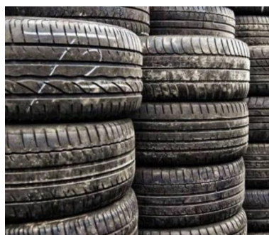
Gambar 3.19 Properti Ban

Properti dan setting merupakan salah satu pendukung untuk menyampaikan simbol dan pesan yang terkandung melalui karya tari. Penggunaan properti dan setting ini tidak boleh semata-mata dekoratif, melainkan harus memiliki tujuan fungsional yang sangat dibutuhkan oleh penari dan karya tari (Murgiyanto, 1983:176). Sesuai dengan pendapat para ahli, karya ini menggunakan properti ban yang berjumlah 20 buah untuk mendukung konsep karya yang disajikan sebagai gambaran tekanan atau beban hidup manusia. Pengkarya terinspirasi dengan bentuk ban yang melingkar seperti roda, sehingga pengkarya menginterpretasikan hal tersebut kepada siklus kehidupan manusia seperti roda berputar, dimulai dari lahir hingga mati manusia harus bisa mengendalikan emosi marah dalam keadaan apapun, dengan siapapun, dimanapun, dan kapanpun sehingga memiliki etika dan moral yang baik.