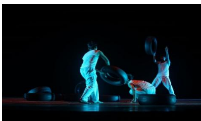
Gambar 3.4 Pose gerak penari yang mengendalikan emosi marah dengan cara yang agresif

Kemudian penari bergantian menyusun ban ke spot tengah, lalu melakukan gerakan cepat melompat-lompat di atas ban sampai penari ada yang klimaks dan terjatuh diatas ban. Pada akhir adegan ini satu orang penari tetap melakukan gerakan melompat di atas penari yang terjatuh di atas ban, lalu satu orang penari naik ke atas tumpukan ban paling tinggi dan berteriak bersamaan dengan respon penari lain dengan gerak bergetar, teriakan dan gerakan bergetar berhenti secara bersamaan.