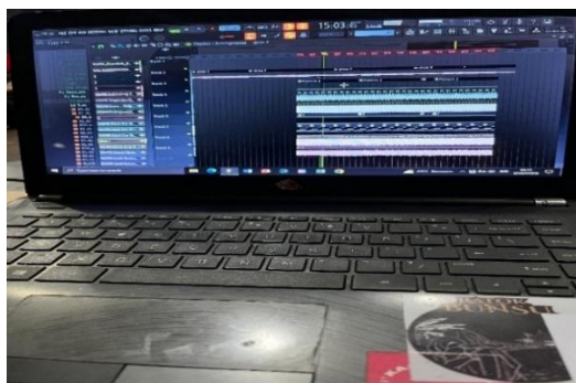
Gambar 3.8 Alat musik Teknolive (Dokumentasi Khairul Asyari, 30 Juni 2024)