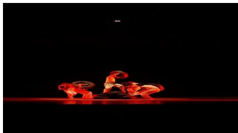
Gambar 3.2 Pose masing- masing penari yang berusaha mengendalikan beban dan tekanan

penari berdiri di atas tumpukan ban dan melakukan gerak eksplorasi terhadap satu ban di tubuhnya. Setelah itu semua penari melakukan gerak melompat, berlari, berdiri, dan terjatuh di atas ban yang menggambarkan bagaimana penari berusaha untuk mengendalikan tekanan atau beban hidupnya masing-masing.