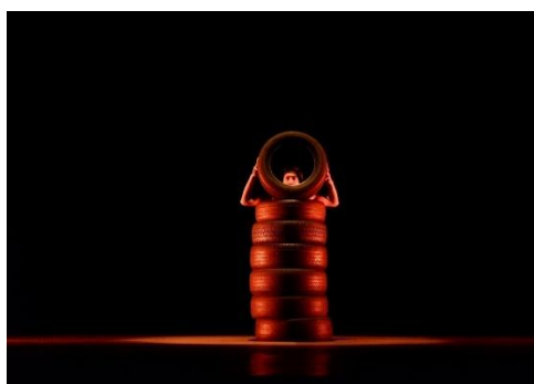
Gambar 3.20 Foto Pertunjukan Karya "Marasoi" Menggunakan Ban (Dokumentasi Arif Basarudin, 17 Juli 2024)