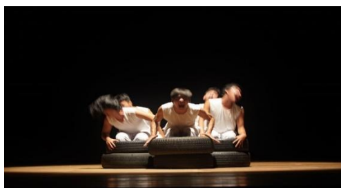
Gambar 3.3 Pose penari dengan emosi marah

Bagian ini diawali dengan lima orang penari berada di atas ban dengan teriakan lalu melakukan gerakan pelan, mengalir, dan juga efek getaran di bagian tengah punggung yang menggambarkan bagaimana tubuh tidak bisa mengendalikan tekanan atau beban hidupnya dengan baik ketika sedang dilanda amarah, sehingga diluapkan dengan cara berteriak dan mengatur pernafasan. Kemudian satu orang penari berdiri di atas penari lain yang berada di atas ban, melakukan gerak eksplorasi yang menggambarkan emosi marah dan digabungkan dengan pola pernafasan. Lalu berdiri tiga orang penari dengan gerak mengalir, setelah itu semua penari berdiri melakukan gerak rampak namun tetap dengan ekspresi marah.