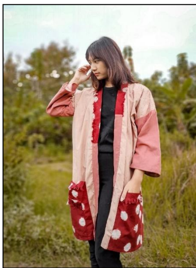
Gambar 4. Foto Busana 4

Judul : Akai Tahun Pembuatan : 2021 Ukuran : All size Teknik : Shibori dan sulam