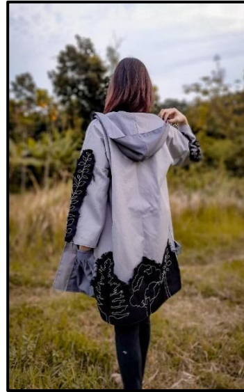
Gambar 3. Foto Busana 3

Judul : Shatsu Tahun Pembuatan : 2021 Ukuran : All size Teknik : Sulam