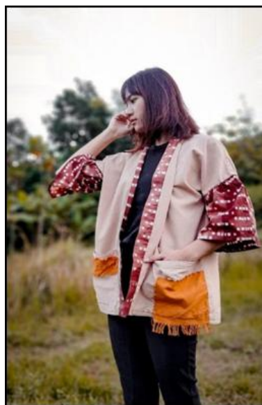
Gambar 1. Foto Busana 1

Judul : Tsuchi Tahun Pembuatan : 2021 Ukuran : All size Teknik : Shibori dan sulam