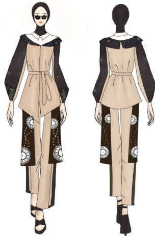
Gambar 4. Desain Terpilih Ready to Wear 3 Sumber: Riska Fitriani, 2024.