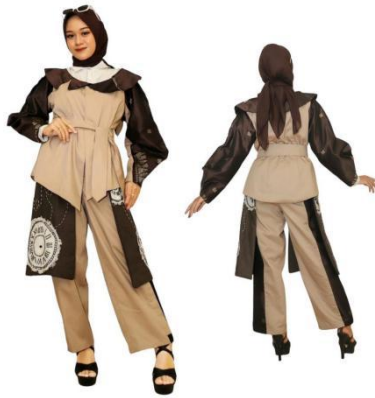
Gambar 12. Hasil Busana Ready to Wear 3

Judul karya : In time Ukuran : L Bahan : Katun dril, songket Silungkang Teknik : Lekapan kain, sulam benang Tahun : 2024