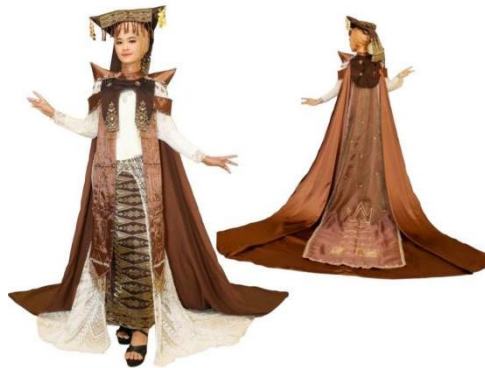
Gambar 15. Hasil Busana Houte Couture