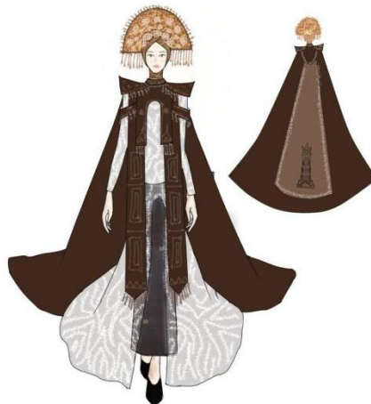
Gambar 7. Desain Terpilih Houte Couture