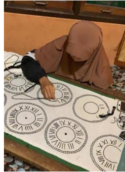
Gambar 8. Menyulam Benang

Pengkarya menggunakan sulam benang pada busana ready to wear , ready to wear deluxe dan houte couture menggunakan teknik tusuk balik, tusuk feston, tusuk rantai terbuka, tusuk melekat benang, dan tusuk lurus.