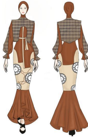
Gambar 3. Desain Terpilih Ready to Wear 2