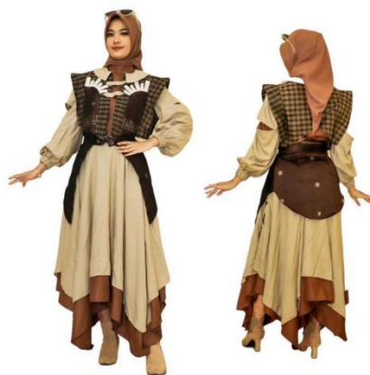
Gambar 10. Hasil Busana Ready to Wear 1 Sumber: Silvia Yuniar, 2024.