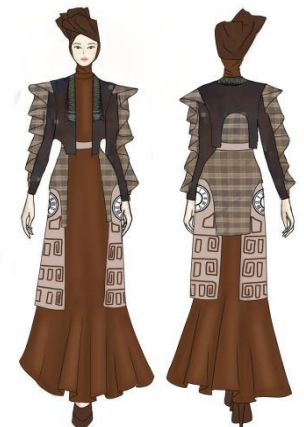
Gambar 5. Desain Terpilih Ready to Wear Deluxe 1