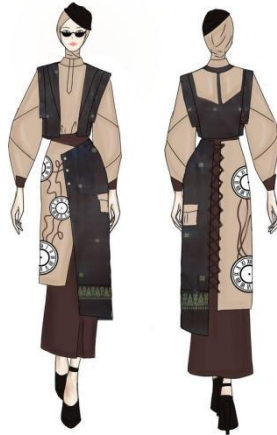
Gambar 6. Desain Terpilih Ready to Wear Deluxe 2