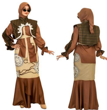
Gambar 11. Hasil Busana Ready to Wear 2