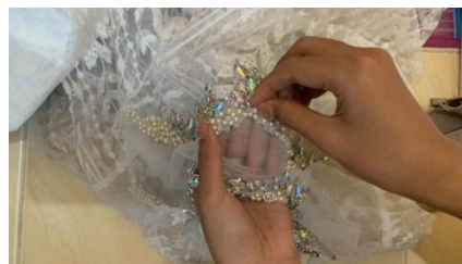
Gambar 9. Mempayet Busana

Sulaman payet merupakan salah satu teknik sulaman manik-manik yang berbentuk pipih dan berukuran kecil yang biasa digunakan untuk menghias busana atau pakaian sebagai pelengkap untuk nilai keindahan busana dengan penyelesaian menggunakan tangan sehingga benda tampak lebih menarik. Teknik ini digunakan pada busana ready to wear deluxe dan houte couture .