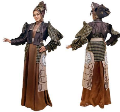
Gambar 13. Hasil busana ready to wear deluxe 1