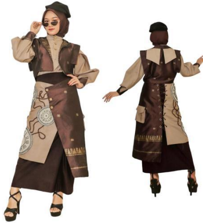
Gambar 14. Hasil Busana Ready to Wear Deluxe 2