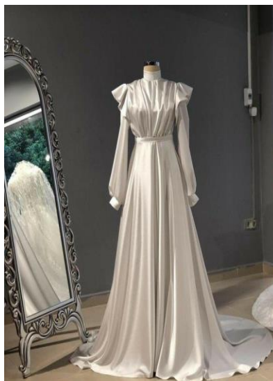
Gambar 3. Ready to wear deluxe by Ceylan Yilmaz

Pada karya busana ready to wear deluxe ini, pengkarya merujuk pada karya Ceylan Yilmaz. Pengkarya merujuk gaya busana tersebut, seperti lengan ruffle , bahan yang digunakan tulle glitter memberikan kesan elegan dan mewah. Busana ini dilengkapi dengan hiasan sulam payet pada bagian atas, seperti leher dan ujung lengan. Pada