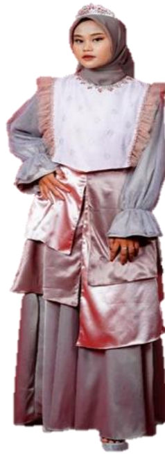
Gambar 14. Hasil Karya Ready To Wear Deluxe