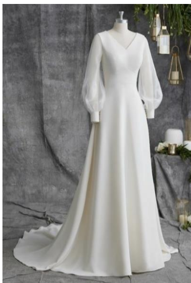
Gambar 2. Ready to wear

Pada busana ini pengkarya mengangkat konsep busana yang menggunakan gaun pesta dengan siluet A, dan menambahkan ikat pinggang dipadukan dengan songket Riau. Pengkarya mengambil rujukan beberapa potongan pada busana tersebut antara lain, yaitu lengan, rok, dan baju yang digunakan bahan diamond satin .