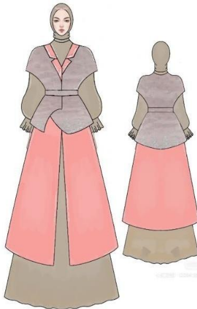
Gambar 5. Desain terpilih ready to wear 1 Digambar oleh: Afifah Nahda Minur, 2024

Setelah melalui proses analisis 18 desain, pengkarya memilih 6 desain terbaik untuk dijadikan karya, yaitu 3 desain ready to wear , 2 desain ready to wear deluxe , dan 1 haute couture .