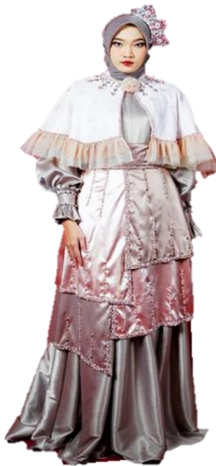
Gambar 16. Hasil Karya Haute Couture