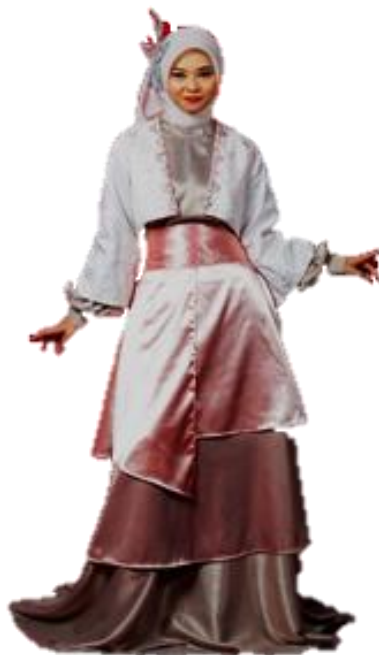
Gambar 13. Hasil Karya Ready To Wear 3

Busana ini dipakai oleh wanita remaja akhir sekitar 17-25 tahun. Pada usia ini wanita remaja akhir lebih fokus untuk mewujudkan cita-cita direncanakan dan mampu membuat keputusan untuk dirinya sendiri. Pada busana ini pengkarya membuat busana menggunakan dengan teknik semi boutique , yaitu teknik yang jahitannya dan penyelesaiannya lebih banyak dikerjakan tangan. Busana ini menggunakan siluet A.