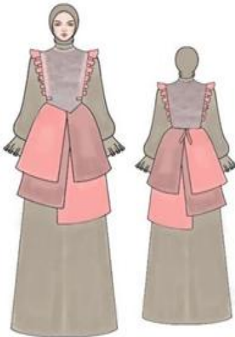
Gambar 8. Desain terpilih ready to wear deluxe Digambar oleh: Afifah Nahda Minur, 2024