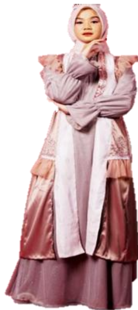
Gambar 15. Hasil Karya Ready To Wear Deluxe 2