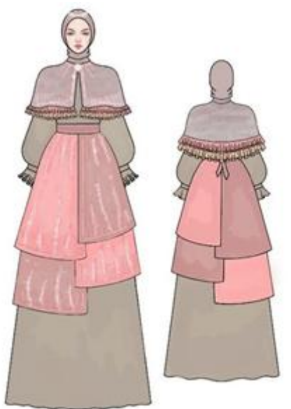
Gambar 10. Desain terpilih haute couture Digambar oleh: Afifah Nahda Minur, 2024