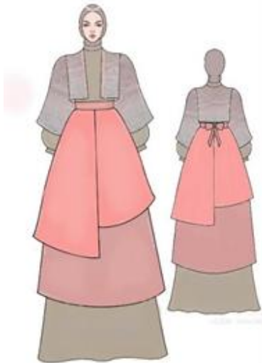
Gambar 7. Desain terpilih ready to wear 3 Digambar oleh: Afifah Nahda Minur, 2024