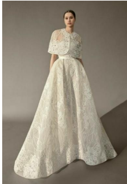
Gambar 4. Haute couture by Ceylan Yilmaz

Pada busana haute couture ini, pengkarya merujuk pada karya Ceylan Yilmaz yang mengangkat konsep busana pesta. Pengkarya menggunakan banyak hiasan manik-manik, dengan mengambil potongan busana cape , pada bagian lengan, lingkaran pergelangan, dan rok.