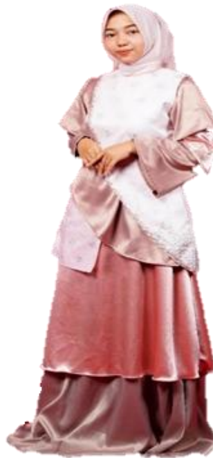
Gambar 12. Hasil karya ready to wear 2