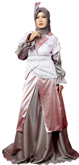
Gambar 11. Hasil Karya Ready To Wear 1