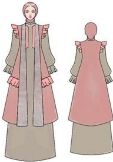
Gambar 9. Desain terpilih ready to wear deluxe 2 Digambar oleh: Afifah Nahda Minur, 2024