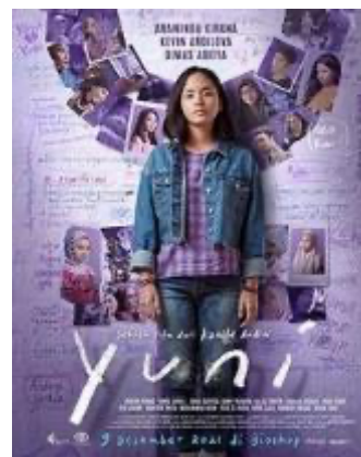
Gambar 3. Poster Film Yuni