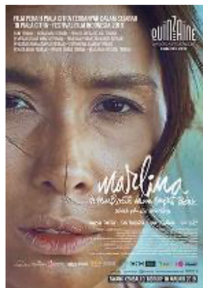
Gambar 2. Poster Film Marlina Sipembunuh Empat Babak