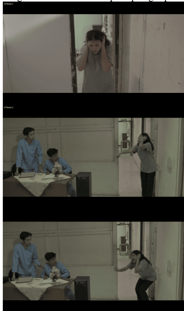
Gambar 9 Ekspresi marah dan teriak scene 14

Tasya dengar. Tasya terus berjalan dengan memegang kepalannya dengan ekspresi menahan sakit, ketika Tasya sudah mengetahui sumber suara berasal dari meja petugas piket, ekspresi Tasya berubah menjadi marah dan suaranya terdengar bergetar. Tasya menunjukkan gestur dan ekspresi kesakitan dengan menutup telinganya dan tidak senang akan suara yang dia dengar dan teriak-teriak kepada petugas piket.