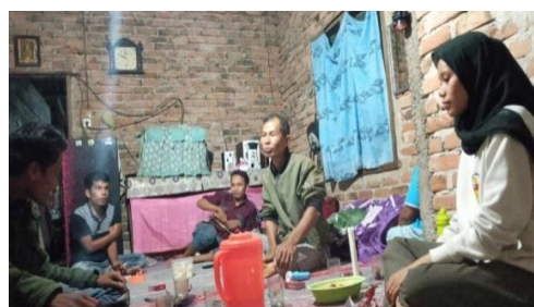
Foto 1: Wawancara dan berdiskusi dengan seniman tradisi (Dokumentasi Medi. 2022)

wawasan dan wacana pengkarya terhadap ciri musikal tradisional mengenai kesenian talempong sebagai fokus penggarapan. Terakhir barulah pengkarya memutuskan untuk menjadikan melodi yang terkesan bolak balik atau yang disebut dengan istilah ( buai ) tersebut untuk dijadikan titik fokus untuk membuat sebuah komposisi musik yang kemudian pengkarya kembangkan menjadi bentuk yang lebih kreatif dengan melibatkan beberapa seniman tradisi untuk berdiskusi dalam membantu pengkarya dalam mewujudkan ide garapan seperti gambar dibawah ini: