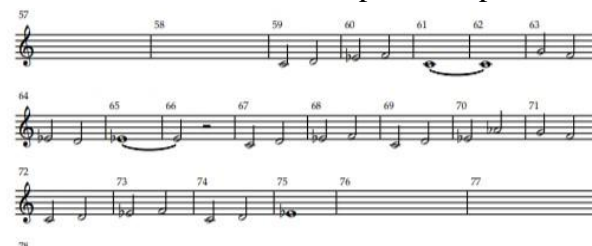
Notasi 12. Part irama vokal (Oleh: Aidil Septian)

Selanjutnya melodi oleh gitar dengan chord Cm, Bdim, A#, A. Setelah satu siklus, masuk ke bagian vokal: