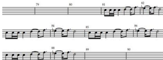
Notasi 13. Part garapan irama vokal. (Oleh: Aidil Septian)