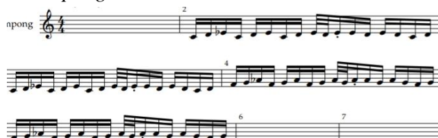
Notasi 5. Part melodi talempong (Oleh: Aidil Septian)

Bagian ini di ulang sebanyak dua kali pengulangan. Pada pengulangan ke dua, tempo yang dimainkan dipercepat, lalu unisono :