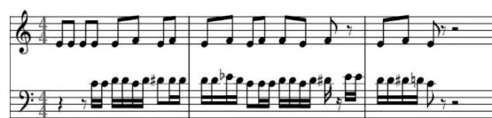
Notasi 2. Tando pada talempong & canang (Oleh: Azzura Yenli Nazrita)

Karya komposisi “ Dua Jiwa dalam Buaian ” pengkarya wujudkan menjadi dua bagian. Pada bagian awal pengkarya memainkan tradisi aslinya yang diawali dengan tando yang dimainkan oleh canang sebanyak tiga kali. Selanjutnya talempong memainkan melodi lagu Buayan Sarin . Tando merupakan unsur yang ada pada permainan tradisi lagu Buayan Sarin . Setelah diberi tando , bonang memainkan pola melodi up beat dan down beat dengan tempo konstan.