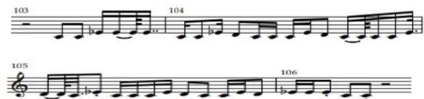
Notasi 16. Part garapan metric 5 & 7 (Oleh: Aidil Septian)

Pola di atas dimainkan sebanyak delapan kali pengulangan, pada pengulangan ke sembilan, tutti oleh seluruh instrument sebanyak empat kali pengulangan. Kemudian gitar, violin, canang , dan cello dan conga memainkan melodi metric tujuh sebanyak lima kali, sementara talempong , gitar bass, dizzy memainkan melodi metric lima. Melodi pada materi di atas di pisah menjadi metric lima dan metric tujuh. Lalu tutti: