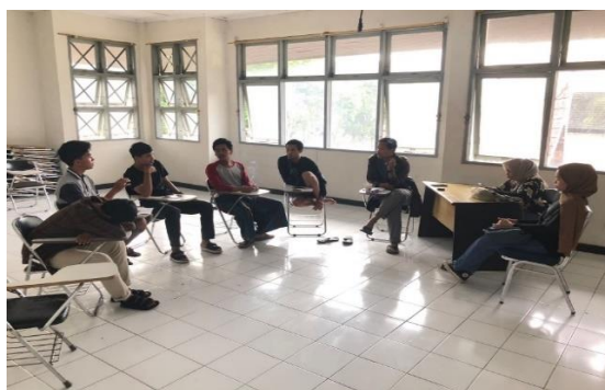
Foto 6: Diskusi bersama tim produksi mengenai konsep pertunjukan