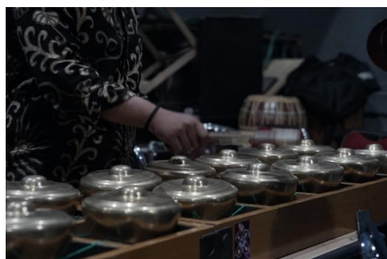
Foto 3: Proses eksplorasi dengan instrument talempong (Dokumentasi Teddy. 2022)