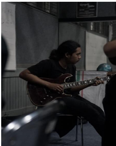
Foto 4: Proses eksplorasi dengan instrument gitar