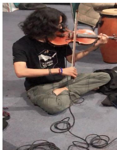
Foto 2: Proses eksplorasi dengan instrument violin

kemudian meminta pemain gitar dan violin memainkan lagu tersebut pada instrument masing-masing. Selanjutnya pengkarya mencoba menggunakan teknik garap yang sesuai untuk digunakan dalam komposisi ini seperti gambar disamping ini: