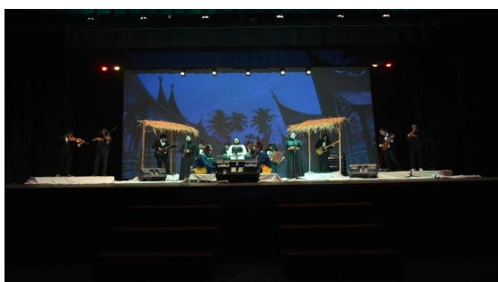
Foto 3 : Kostum dan pertunjukan tugas akhir Dokumentasi oleh Rahmad Didi 2021