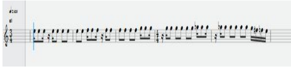
Notasi 4 Oleh Aidil Septian Nugraha

permainan Unisono oleh semua instrumen seperti berikut