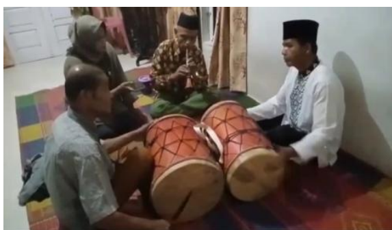
Foto 1: Wawancara dengan seniman tradisi 19 September 2021

Ketika tujuh warna bunyi tersebut dimainkan. Adapun lagu/pola tabuhan yang terdapat pada Gandang Sarunai yaitu: Gandang Solok , Gandang Pado-pado , Gandang Duo , Gandang Sikupiciak , Gandang Duo Iliu , Gandang Sikudidi , Gandang Sikudidi Mandi , Barabah di Ateh Paki , Kumpai Anyuik , Tajak Guyah , Siamang Taghagau , dan Cancang Mudiak Ayiu . Pada setiap pola tabuhan lagu-lagu tersebut memiliki perbedaan satu sama lain demikian juga bunyi yang dihasilkan.