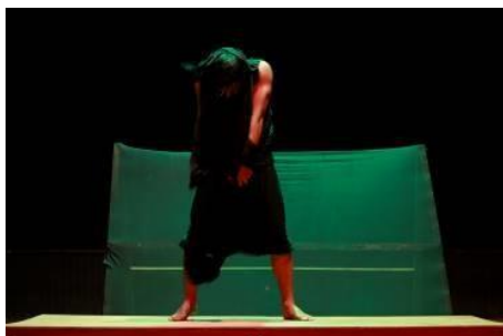
Foto 16 : Bagian Ketiga Karya "Fake Smile"