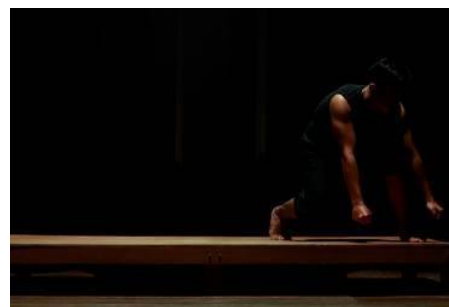
Foto 14 : Bagian Pertama Karya "Fake Smile"