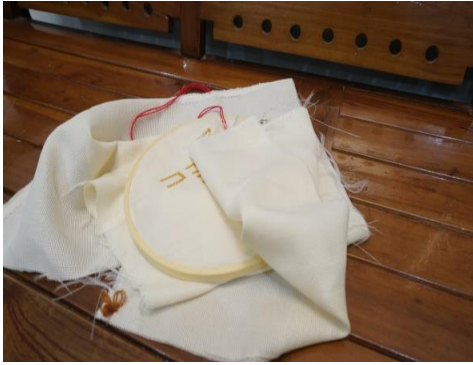
Gambar 3. Kaca Mata dan Strimin Gusti Biang (Foto. Nia, 2018)