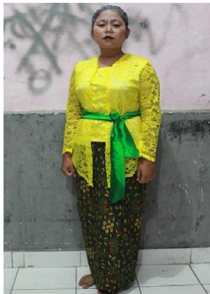
Gambar 6. Kostum Gusti Biang