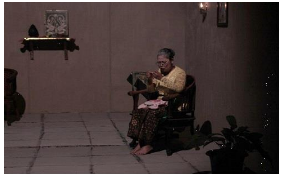
Gambar 9. Adegan saat Gusti Biang memasukan benang ke dalam jarum.