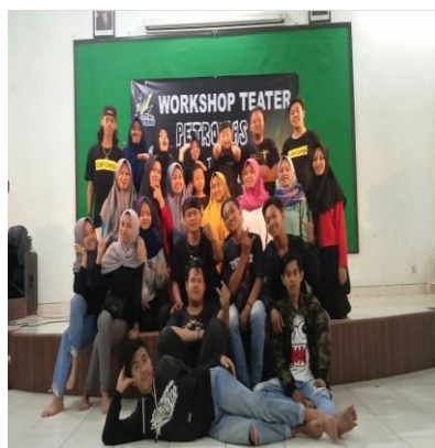
Gambar 8 dan 9 (Dokumentasi Teater Petromas 11 PM, 2019)

Selain mengadakan acara dan mengisi acara di dalam kampus, Teater Petromas 11 PM juga pernah mengikuti lomba teater tingkat nasional di Solo. Teater Petromas 11 PM menampilkan monolog yang berjudul Cermin, kegiatan tersebut