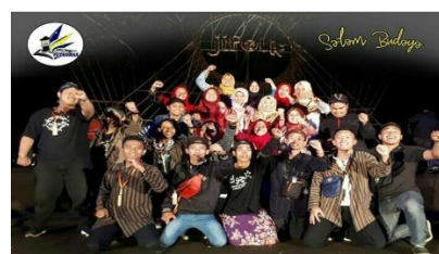
Gambar 12. (Dokumen Teater Petromas 11 PM, 2019)

Selain di kampus, Teater Petromas 11 PM melebarkan aktifitas hingga ke kedinasan dan para pelaku seni dan budaya di daerah Temanggung. Sering mengikuti berbagai acara dari dinas, menjadi panitia pelaksana, tamu undangan, peserta dan lain-lain. Kerjasama dengan lembaga atau pelaku seni dan budaya di Temanggung perlu dijaga sebagai relasi yang baik dan membangun untuk Teater Petromas 11 PM ke depan.