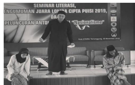
Gambar 5. (Dokumentasi, Teater Petromas 11 PM, 2019)

Selain mementaskan seni drama, Teater Petromas 11 PM juga sering mengisi di acara-acara kampus salah satunya seminar nasional yang diadakan salah satu lembaga kampus. Seperti yang belum lama ini, menampilkan teatrical puisi.