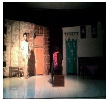
Gambar 10 dan 11

diikuti sebagai ajang untuk menampilkan kreatifitas anggota Teater Petromas 11 PM dan juga menjaga eksistensi Teater Petromas 11 PM di luar kampus.