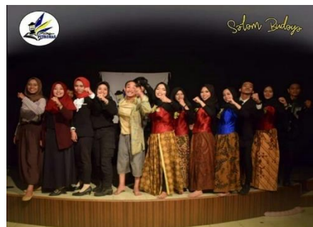
Gambar 5. (Dokumentasi Teater Petromas 11 PM, 2019)

Berbagai strategi dilakukan Teater Petromas 11 PM untuk mengembangkan seni di kampus STAINU Temanggung, salah satunya adalah tampil di berbagai acara yang diadakan oleh kampus seperti saat OSPEK (Orientasi Pengenalan Kampus), mementaskan drama “Sidang Susila” hal tersebut dilaksanakan selain menampilkan seni drama, juga untuk mengenalkan kepada mahasiswa baru adanya Teater Petromas 11 PM dan juga perekrutan anggota baru.