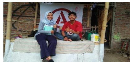
Gambar 2.

Teater Petromas 11 PM menjadi wadah bagi mahasiswa STAINU Temanggung untuk menyegarkan pikiran se usai merasa jenuh dengan perkuliahan. Karena pembawaanya santai, tidak kaku, dan banyak belajar megenal lingkungan sekitar. Teater Petromas 11 PM tidak hanya belajar tentang soft skill , namun juga nilai-nilai An-Nahdliyah yang menjadi ciri khas di STAINU Temanggung yaitu belajar tentang ketauhidan, etika, tawasul, persaudaraan, dan lain-lain. Tentunya hal ini menjadi ciri khas Teater Petromas 11 PM dengan teater atau grup seni yang ada di kampus yang lain. Adanya Teater Petromas 11 PM di STAINU Temanggung mengubah cara pandang masyarakat umum bahwa, STAINU juga dapat bersifat lentur walaupun tidak ada jurusan atau program studi eksak. (Wawancara dengan Ibrahim Fahmi, Pembina Teater Petromas 11 PM).