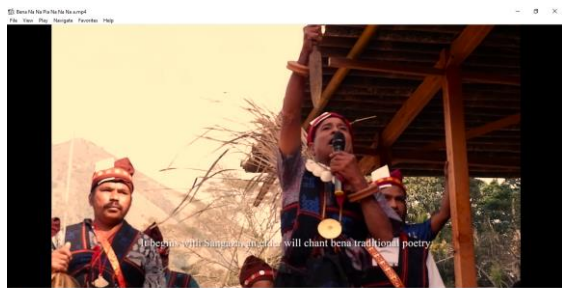
Gambar 3 : Screenshot bagian kedua Bena berdasarkan draft naskah