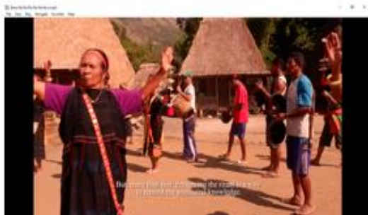
Gambar 5 : Screenshot bagian ketiga Bena berdasarkan draft naskah