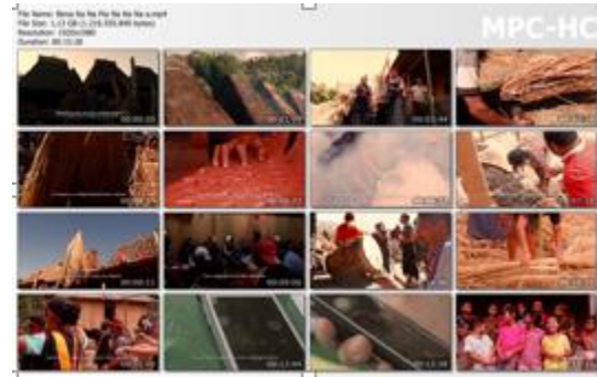
Gambar 5 : Thumbnail keseluruhan film dokumenter Bena Na Na Pia Na Na Na'a 2020

Durasi pada film dokumenter Bena Na Na Pia Na Na Na'a adalah 15 menit 27 detik dengan format file .mp4 . Setiap frame yang terdapat narasi berupa audio diberikan subtitle dalam bahasa Inggris. Tujuannya agar informasi yang ada pada setiap narasi yang diucapkan dalam bahasa Indonesia dapat dipahami oleh masyarakat yang bukan berasal dari Indonesia saja. Hal ini berlandaskan pada hasil observasi di lapangan bahwasannya penonton atau penikmat pertunjukkan ritual suku Bena bukan hanya wisatawan lokal melainkan mancanegara.