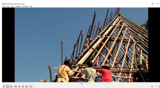
Gambar 4 : Screenshot bagian kedua Bena berdasarkan draft naskah Sumber : dokumen pribadi penulis. 2020