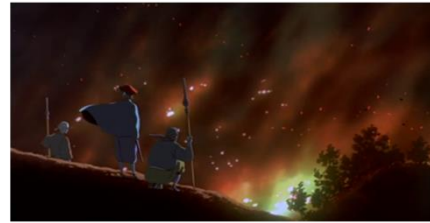
Gambar 2: Eboshi dan Pasukannya berhasil mengusir Nago dan membumi-hanguskan hutan.

tak berdaya ketika berhadapan dengan pasukan ishibiyashuu yang dipimpin oleh Eboshi. Selain itu Nago mendapat tembakan dari Ishibiya Eboshi sehingga biji besi tertanam ditubuhnya.