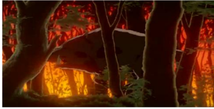
Gambar 1: Nago tak berdaya menghadapi Eboshi dan pasukan ishibiyashuu yang membakar hutannya.