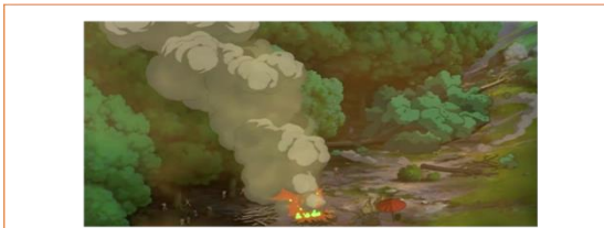
Gambar 4 : Pasukan Eboshi- Jiko dengan sengaja menebang pohon dan membakarnya di depan hutan.