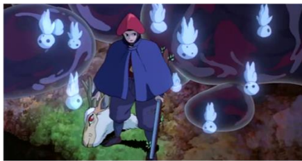
Gambar 3 : Eboshi berhasil mendapatkan kepala Shishigami .

yang berlangsung di hutan saat itu. Secara tak langsung Eboshi sudah merencanakan untuk membumi hanguskan hutan tersebut, dan hal tersebut dilakukan lebih awal karena adanya gangguan dari Nago. Dalam hal ini Eboshi juga menguji kekuatan dan jangkauan dari senjata Ishibiya-nya. Dan Eboshi berhasil menguji senjatanya tersebut dan misinya berjalan sesuai rencananya. Seluruh tumbuhan dan pohon hangus dan tak ada satupun yang terlewat oleh senjata tersebut.