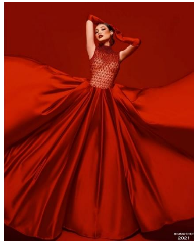
Gambar 1 Karya: RioMotret Sumber: riomotret.com, 2021

Karya fotografi fashion RioMotret ini menampilkan seorang model professional yang menggunakan gaun merah dengan background merah. Selain itu penggunaan lighting , key light dan fill light bertujuan mengiring penikmat karyatertuju ke gaun yang digunakan oleh model. Dalam kata lain yang jadi point of interest adalah gaun yang digunakan oleh model.