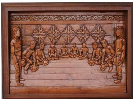
Gambar 16. Hasil Karya 2

Seluruh figur digambarkan duduk dilantai, mencerminkan nilai kesantunan, kesetaraan, dan penghormatan terhadap tatanan adat. Penutup kepala berupa lilitan kain yang disebut jembolang menjadi simbol marwah atau kehormatan, sekaligus identitas masyarakat Gayo. Secara keseluruhan, karya ini menegaskan bahwa setiap langkah penting dalam kehidupan idealnya diawali dengan restu dan doa sebagai wujud penghormatan terhadap nilai-nilai tradisi.