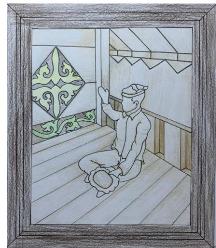
Gambar 14. Desain Terpilih 7 ( Digambar: Ricky Chandra. 2026)