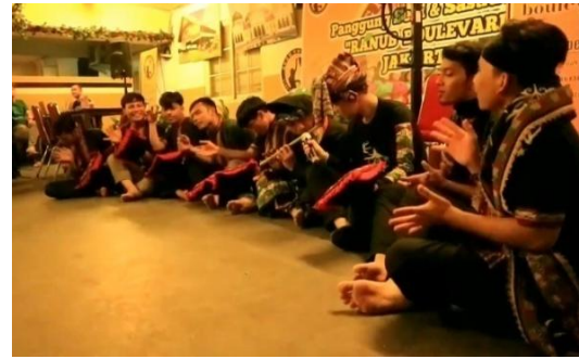
Gambar 4. Gerakan Dan Meniup Suling Pada Kesenian Didong Gayo