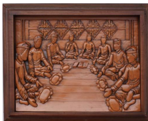
Gambar 17. Hasil Karya 3

Keterbukaan ruang kosong yang luas dilantai kayu (bagian depan) melambangkan kejernihan niat sebelum pertunjukan dimulai, hati dan keadaan harus bersih dan lapang. Bentuk penutup kepala yang digunakan merupakan lilitan kain yang disebut jembolang , berperan penting pada marwah (kehormatan) melambangkan identitas masyarakat Gayo.