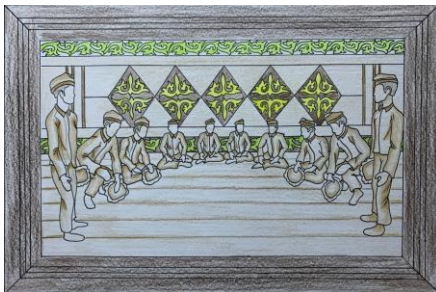
Gambar 9. Desain Terpilih 2 ( Digambar: Ricky Chandra. 2026)