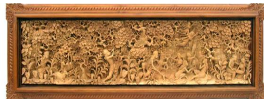
Gambar 6. Relif Legenda Jawa