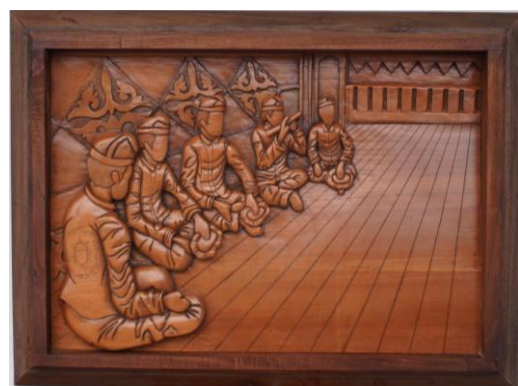
Gambar 20. Hasil Karya 6

Motif emun berkune , emun berangkat , dan pucuk nituwis , terletak pada dinding dan pakaian, melambangkan perjalanan hidup serta kelanjutan tradisi yang diwariskan antar generasi. Secara keseluruhan, karya ini menggambarkan pertemuan adat sebagai ruang kebersamaan yang menyatukan pengetahuan dan perasaan, serta menegaskan pentingnya musyawarah dan penghormatan terhadap nilai budaya dalam menjaga keharmonisan sosial.