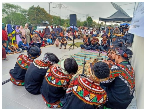
Gambar 3. Pakaian saat Pertunjukan Kesenian Didong Gayo