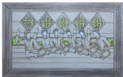
Gambar 11. Desain Terpilih 4 ( Digambar: Ricky Chandra. 2026)