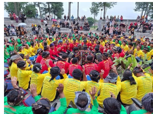
Gambar 5. Pertunjukan Secara Masal Kesenian Didong Gayo