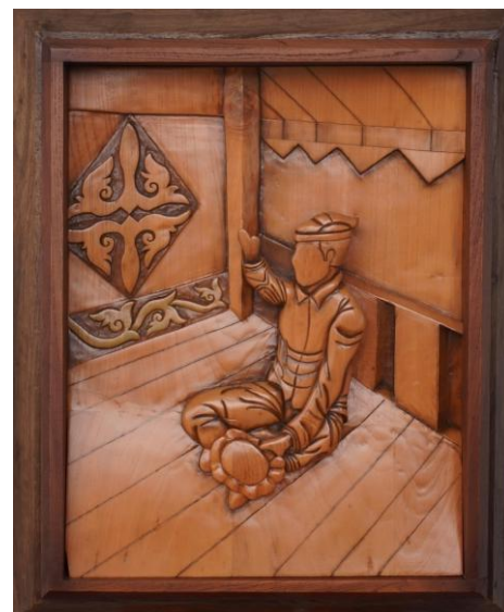
Gambar 21. Hasil Karya 7

Motif emun berkune pada dinding bagian melambangkan perlindungan, keteguhan, dan keterikatan pada adat. Ruang kosong disisi kanan melambangkan ruang peluang, dan keterbukaan terhadap generasi berikutnya, memberi tempat bagi keberlanjutan tradisi yang akan diisi oleh penerusnya.