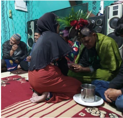
Gambar 1. Proses Tepung Tawar Repro: Riky Chandra. 2025 (Sumber: Wen Gemade. 2024)