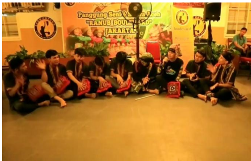
Gambar 2. Tepukan Kesenian Didong Gayo Repro: Riky Chandra. 2025 (Sumber: Wen Gemade. 2024)