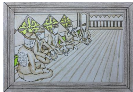
Gambar 13. Desain Terpilih 6 ( Digambar: Ricky Chandra. 2026)