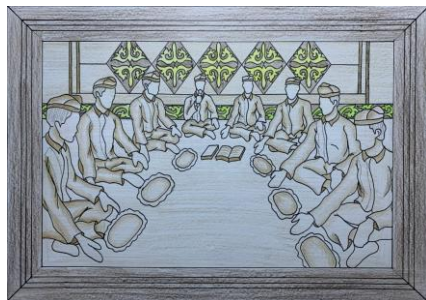
Gambar 10. Desain Terpilih 3 ( Digambar: Ricky Chandra. 2026)