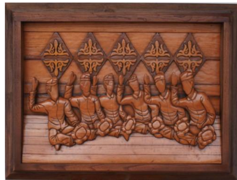
Gambar 18. Hasil Karya 4

Keberadaan dua buku melambangkan sumber pengetahuan dan pedoman hidup yang menjadi pegangan bersama. Posisi tangan kiri di atas lutut dan tangan kanan terjulur kebawah menggambarkan sikap rendah hati, terbuka, dan siap menerima nasihat. Motif emun berangkat dan emun berkune pada dinding belakang menjadi tanda identitas budaya serta kesinambungan tradisi. Secara keseluruhan, karya ini dimaknai sebagai ruang jeda untuk menenangkan diri, berbagi pengetahuan, dan memperkuat kebersamaan dalam kehidupan masyarakat Aceh.