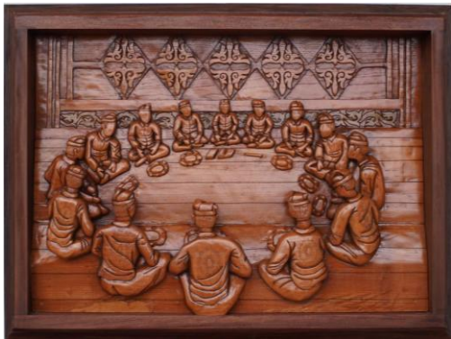
Gambar 19. Hasil Karya 5

keselarasan gerak, dan kekuatan tradisi. Setiap simbol dan tanda visual mulai dari posisi duduk, gerak tangan, penutup kepala, hingga motif emun berkune saling terhubung membentuk satu makna utuh tentang persatuan, identitas budaya, dan nilai-nilai luhur yang terus dijaga dan diwariskan dari generasi ke generasi.