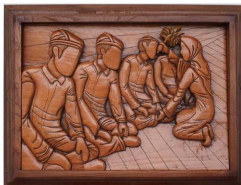
Gambar 15. Hasil Karya 1

Judul : Peutawaren Ukuran : 102 cm x 77 cm Bahan : Kayu Surian Pewarna : Melamin, Wood Filler, Seanding Sealer, Clear Coat Doff Teknik : Relief Tahun : 2025