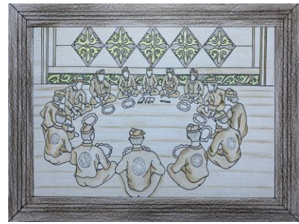
Gambar 12. Desain Terpilih 5 ( Digambar: Ricky Chandra. 2026)