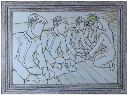
Gambar 8. Desain Terpilih 1 ( Digambar: Ricky Chandra. 2026)