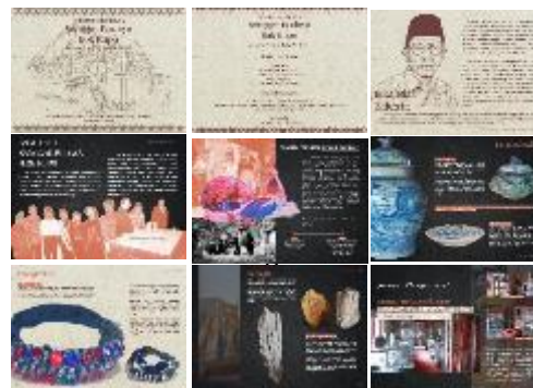
Gambar 2. Hasil Karya Buku

Buku merupakan hasil pemikiran yang dianalisis menjadi ilmu pengetahuan, disusun dan ditulis dengan bahasa sederhana, dengan gambar dan daftar pustaka (12) .