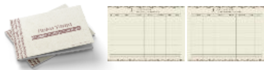
Gambar 5. Hasil Karya Buku Tamu