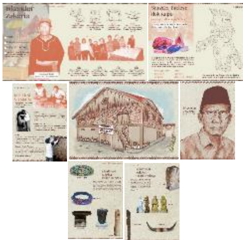
Gambar 3. Hasil Karya Poster

Poster adalah sebagai kombinasi visual dari rancangan yang kuat, dengan warna, dan pesan dengan maksud untuk menangkap perhatian orang yang lewat tetapi cukup lama menanamkan gagasan yang berarti di dalam ingatannya (14) .