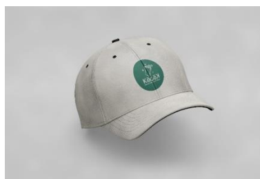
Gambar 12. Topi

Kocok Indonesia menjadikan topi sebagai merchandise, didesain dengan menampilkan pada bagian depan logo Kocok Indonesia. Nantinya dapat dipakai oleh crew Kocok Indonesia.