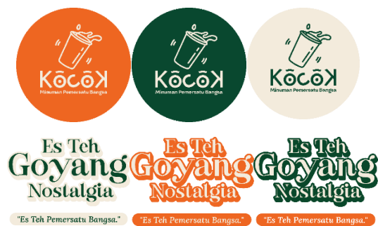
Gambar 14. Stiker

Stiker salah satu merchandise yang bisa diberikan kepada konsumen Kocok Indonesia berguna sebagai media promosi, desain pada stiker Kocok Indonesia terdiri dari logo Kocok Indonesia dan label menu Es Teh Goyang Nostalgia.