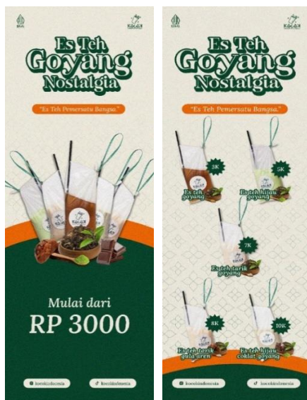
Gambar 6. Banner

Banner dipakai oleh Kocok Indonesia dicetak ukuran 60cm x 160cm berguna sebagai media promosi yang berisi pesan atau informasi yang berupa foto produk, harga, nama sosial media, nama varian menu dengan desain yang menarik sesuai keyword pada brainstorming yaitu klasik, modern, dan minimalis sehingga menarik minat konsumen. Konsep klasik diaplikasikan pada typeface berjenis serif, penggunaan struk tebal pada tulisan Es Teh Goyang Nostalgia dan memberikan effect noise . Pengaplikasian konsep modern pada menonjolkan foto produk yang jernih, supergraphic dan memberikan bentuk sedikit melengkung yang sederhana. Pengaplikasian konsep minimalis pada layout yang sederhana, seimbang dan tidak menggunakan banyak bentuk. Banner Kocok Indonesia ada dua buah, pertama menginformasikan mulai harga dan foto produk, yang kedua menginformasikan semua foto produk dan