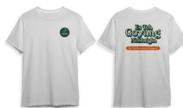
Gambar 11. Kaos

Kocok Indonesia menjadikan kaos sebagai merchandise, didesain dengan menampilkan pada bagian depan logo dan bagian belakang nama menu Kocok Indonesia yaitu Es Teh Goyang Nostalgia.