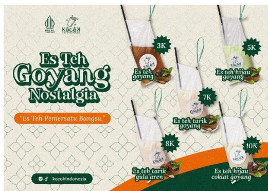
Gambar 5. Daftar Menu

Daftar menu berfungsi sebagai media promosi yang dipakai oleh Kocok Indonesia untuk menginformasikan nama menu, nama produk, harga produk, konten sosial media sehingga memudahkan konsumen memahaminya.