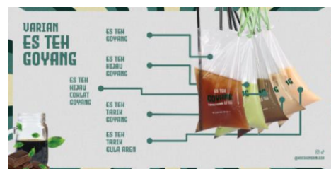
Gambar 1. Menu

Kocok Indonesia sebelumnya hanya menghadirkan menu milkshake melakukan pengembangan menu dengan menghadirkan menu baru berbahan teh. Akhirnya owner melaunching pada bulan mei 2023 menu baru yang bernama Es Teh Goyang Nostalgia. Varian yang tersedia dengan berbagai varian rasa dan pengemasan berbeda dibandingkan varian sebelumnya yaitu menu milkshake. Kendati menghadirkan varian teh dengan rasa yang beraneka ragam dengan harga yang lebih terjangkau, dengan pengemasan yang dilakukan dengan konsep tradisional menggunakan plastik dan gantungan tali raffia seperti halnya bungkus minuman pada zaman dahulu, seperti gambar berikut :