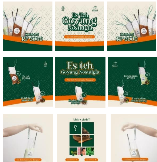
Gambar 9. Konten Instagram

Final konten Instagram berupa sebuah feed yang disusun berukuran 1080 px x 1080 px dengan informasi, foto produk, harga, dan game, hal ini bertujuan agar konsumen tau tentang menu baru Kocok Indonesia yaitu Es Teh Goyang Nostalgia.