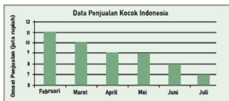
Gambar 2. Diagram Penjualan

Owner nantinya ingin mempromosikan kembali dengan pengembangan dan strategi baru menggunakan tempat penjualan berupa gerobak sepeda listrik sehingga dapat menjangkau target yang dituju.