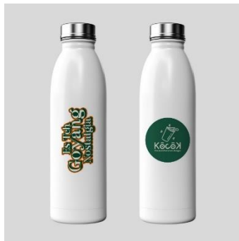
Gambar 13. Tumbler

belakang nama menu Es Teh Goyang Nostalgia.