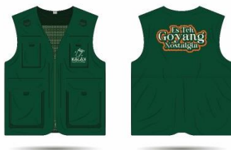
Gambar 10. Konten Instagram

Rompi didesain dengan menampilkan pada bagian depan logo dan bagian belakang nama menu yaitu Es Teh Goyang Nostalgia. Nantinya bisa digunakan menjadi seragam pegawai Kocok Indonesia.