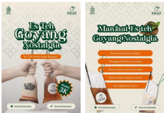
Gambar 8. Poster

Poster Kocok Indonesia ada dua buah desain yang mana disetiap desain memiliki informasi yang berbeda. Pada desain pertama menginformasikan foto produk dan mulai harga, pada poster kedua menginformasikan manfaat teh dan foto produk.