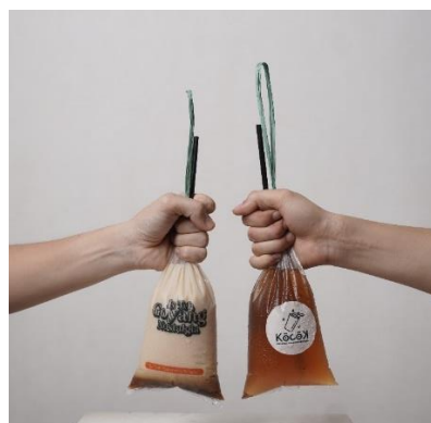
Gambar 4. Label Kemasan

Label kemasan berfungsi sebagai identifikasi produk dan sumber informasi produk supaya konsumen mudah mengenali. Dari gambar dibawah dapat dilihat logo dan tagline diletakkan dibagian salah satu sisi plastik.