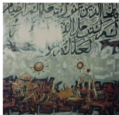
Gambar 3. “Tentang Keagungan Tuhan” Media: cat minyak pada triplek Tahun: 1989 Ukuran: 65 x 55 cm

Dalam Tafsir Jalalain jika ayat ini memiliki nilai-nilai ketauhidan hal ini berdasarkan dari kandungan surah At-Taubah 129 (Jika mereka berpaling) dari iman kepadamu (maka katakanlah, "Cukuplah bagiku) maksudnya cukup untukku (Allah; tidak ada Tuhan selain Dia. Hanya kepada-Nya aku bertawakal) percaya dan bukan kepada selain-Nya (dan Dia adalah Rabb yang memiliki Arasy) yakni Al-Kursiy (yang agung). Arasy disebutkan secara khusus karena ia makhluk yang paling besar.