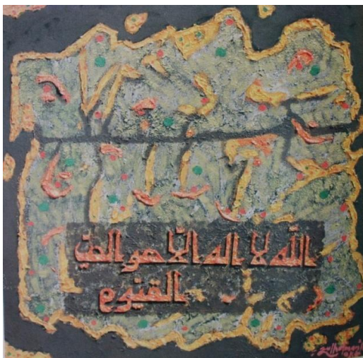
Gambar 1. “Hanya Allah yang Layak Disembah” Media: mixed media pada kanvas Tahun: 2016

Bentuk-bentuk kaligrafi pada seni lukis kaligrafi karya Zulhelman yang memiliki ciri khas seperti gambar 1.