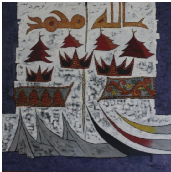
Gambar 5. “Adaik Basandi Syarak”

dimensi syara (Islam). Sebab ajaran agama Islam meliputi dua pokok yang utama, yaitu ajaran hubungan antar manusia dengan Allah ( Habluminaalah ) dan hubungan manusia dengan manusia ( Habluminannas ). Oleh sebab itu antara adat dan agama di Minangkabau tidak dapat dipisahkan.